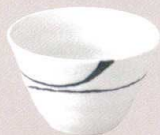
7523171 リップル碗小 ¥700 D11 H7.3(310cc)