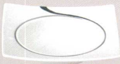
7523120 リップル17.5cm角ボール ¥2,000 D17.5 H4.6 ID12 IH2.5