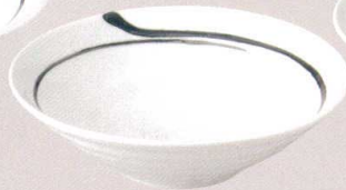
7523157 リップル7.0鉢 ¥1,850 D23.2 H6.4