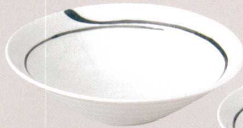
7523159 リップル8.0鉢 ¥2,100 D26.2 H7