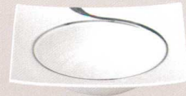
7523121 リップル19.5cm角ボール ¥2,400 D19.5 H4.8 ID13.5 IH2.8