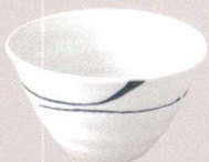
7523173 リップル碗大 ¥880 D13.7 H7.5(490cc)