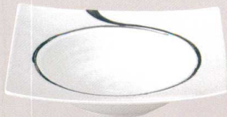
7523123 リップル24.5cm角ボール ¥3,800 D24.5 H6 ID16.5 IH3.5