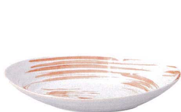
7423183 リップル30cmオーバル ¥3,450 L30 S19.5 H6