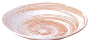
7423110 リップル8.5皿 ¥1,600 D25.7 H4.5 7423109 リップル7.5皿 ¥1,000 D23.7 H4.4