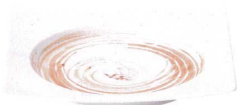
7423193 リップル26.5cm角皿 ¥3,250 D26.5 H4 ID20.8