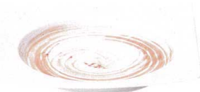
7423192 リップル24cm角皿 ¥2,750 D24 H3.8 ID18.5