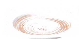
7423191 リップル22.5cm角皿 ¥2,300 D22.5 H3.6 ID17.6