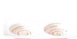
7423133 リップル2品盛 ¥1,100 L19.3 S10.2 H2.6