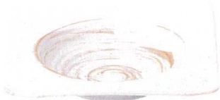
7423123 リップル24.5cm角ボール ¥3,650 D24.5 H6 ID16.5 IH3.5