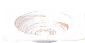
7423122 リップル22cm角ボール ¥2,750 D22 H5.5 ID15.2 IH3