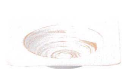
7423121 リップル19.5cm角ボール ¥2,400 D19.5 H4.8 ID13.5 IH2.8