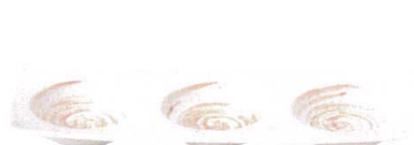
7423135 リップル3品盛 ¥1,600 L28.4 S10.5 H2.8