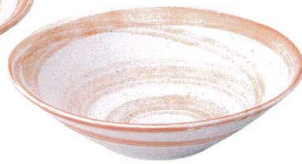
7423157 リップル7.0鉢 ¥1,700 D23.2 H6.4