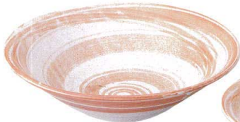
7423159 リップル8.0鉢 ¥2,000 D26.2 H7