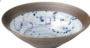
3443157 リップル7.0鉢 ¥1,900 D23.2 H6.4