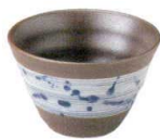
3443171 リップル碗小 ¥730 D11 H7.3(310cc)