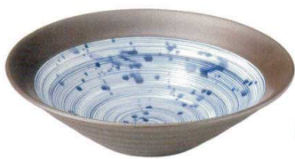
3443159 リップル8.0鉢 ¥2,200 D26.2 H7