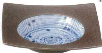
3443123 リップル24.5cm角ボール ¥3,900 D24.5 H6 ID16.5 IH3.5