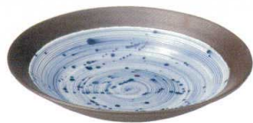
3443110 リップル8.5皿 ¥1,800 D25.7 H4.5 3443109 リップル7.5皿 ¥1,150 D23.7 H4.4