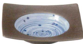
3443122 リップル22cm角ボール ¥2,900 D22 H5.5 ID15.2 IH3