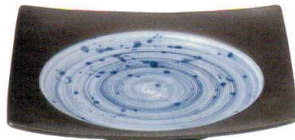
3443191 リップル22.5cm角皿 ¥2,500 D22.5 H3.6 ID17.6