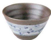
3443173 リップル碗大 ¥900 D13.7 H7.5(490cc)