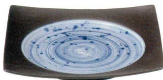
3443192 リップル24cm角皿 ¥2,900 D24 H3.8 ID18.5