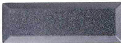
0304972 32cm 細角皿 ¥2,300 L32 S11.2 H1.8