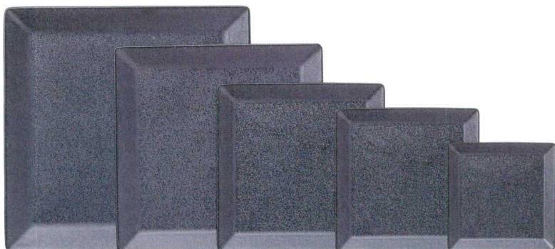
0300668 30.5cm角プレート ¥4,900 D30.7 H1.8 0300666 26.5cm角プレート ¥2,800 D26.7 H2.5 0300664 20.5cm角プレート ¥1,850 D20.5 H2.2 0300663 18cm角プレート ¥1,500 D18 H2 0300661 14cm角プレート ¥1,000 D14 H2