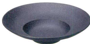
0307024 24cm/ハットボール ¥2,000 D24.5 H5.8