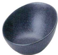
0304324 17cmスライスボール ¥1,900 L17.2 S16.1 H10.3