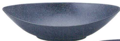
0307080 30cm笹形ボール ¥3,500 L30.1 S15.7 H8.2