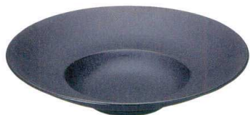
0307022 28cm/ハットボール ¥3,100 D28 H6.4