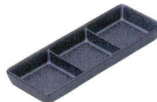
0307472 仕切3品 ¥1,550 L20 S7 H2.5