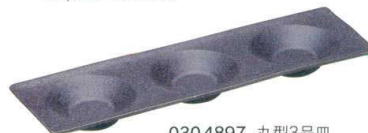
0304897 丸型3品皿 ¥1,750 L30.4 S9.6 H2.3