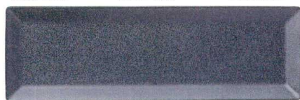
0304970 34.5cm細角皿 ¥2,950 L34.9 S11.2 H1.8