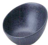
0304325 13.5cmスライスボール ¥1,400 L13.6 S13 H9