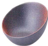
7384325 13.5cmスライスボール ¥1,600 L13.6 S13 H9