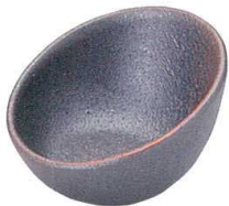
7384324 17cmスライスボール ¥2,200 L17.2 S16.1 H10.3