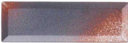
7384970 34.5cm細角皿 ¥3,350 L34.9 S11.2 H1.8