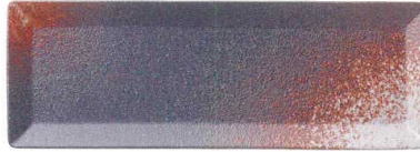
7384972 32cm 細角皿 ¥2,600 L32 S11.2 H1.8