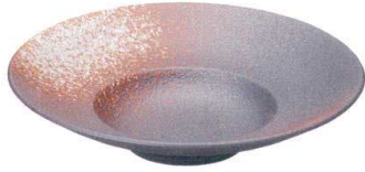
7387022 28cmハットボール ¥3,650 D28 H6.4