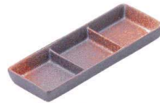
7387472 仕切3品 ¥1,750 L20 S7 H2.5