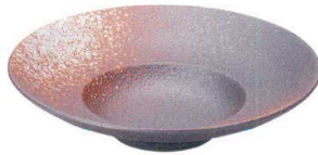
7387024 24cmハットボール ¥2,650 D24.5 H5.8