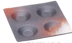
7384895 丸型4品スクエア ¥2,850 L21 H2.3