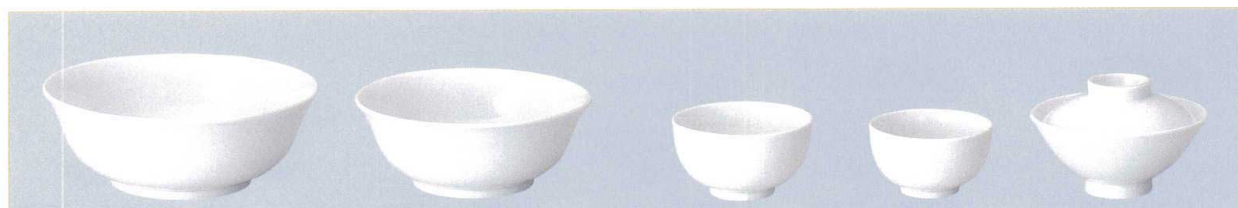
9000214 9"スープ ¥1,900 D23 H8.5 9000212 8"スープ ¥1,000 D20.7 H8 9000071 3.8ライス碗 ¥350 D12 H6.5 9000070 3.5ライス碗 ¥330 D10.2 H6 9001030 蓋付き鯛茶井 蓋 ¥330 D13.4 H3.7 9001031 蓋付き鯛茶井 身 ¥500 D15.3 H6.8