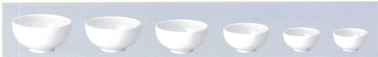
9000057 5.6多用丼 ¥1,300 D17 H8.5 9000056 5.3多用丼 ¥950 D16 H8 9000055 5.0多用丼 ¥850 D15 H7.5 9000053 4.3多用丼 ¥600 D13 H6.5 9000051 3.6多用丼 ¥450 D11 H5.5 9000050 3.0多用丼 ¥350 D9.5 H4.9