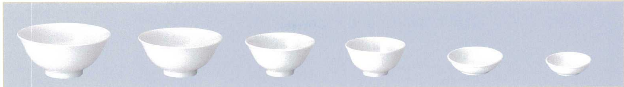
9000063 5.0スープ碗 ¥450 D15 H6.7 9000064 4.5スープ碗 ¥400 D13 H6.2 9000062 4.0スープ碗 ¥330 D11.7 H5.8 9000061 3.5スープ碗 ¥280 D10.5 H5.5 9000091 3.0薬味皿 ¥300 D10 H2.8 9000090 2.6薬味皿 ¥280 D8 H2.4