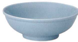
9010237 7.0玉淵井 ¥1,800 D21.8 H8