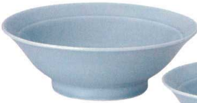
新商品 9010540 8.5リム井 ¥2,600 D26.5 H9.3 9010539 8.0リム井 ¥2,100 D24.5 H8.3