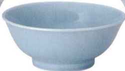
9010136 6.8高台井 ¥1,000 D21.2 H8.5