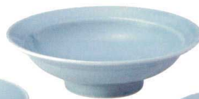
9010179 8.0丸高台皿 ¥1,900 D24.5 H7