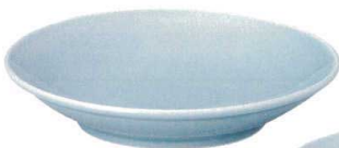
9010115 8.0フカヒレ皿 ¥2,400 D24.3 H5