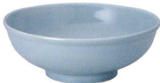
9010239 8.0玉淵井 ¥3,000 D25 H9.3