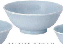
9010133 5.8高台井 ¥680 D17.7 H7.4