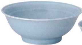
9010138 7.5高台井 ¥1,700 D23 H9.2