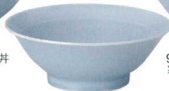
9010536 6.8リム 井 ¥950 D20.2 H7.5