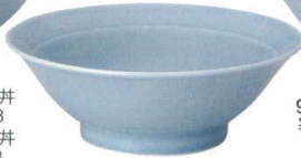
9010538 7.5リム 井 ¥1,500 D23 H8.3