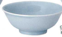
9010134 6.3高台井 ¥800 D19 H7.7