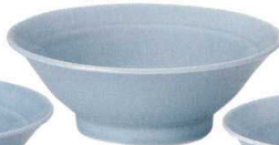
9010537 7.0リム 井 ¥1,050 D21.3 H7.6