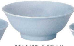
9010135 6.5高台井 ¥850 D20 H8.5