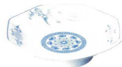
9050170 八角シューマイ ¥1,000 D19.5 H4.7