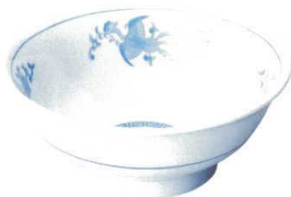
9050136 6.8高台井 ¥1,200 D21.2 H8.5