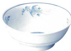
9050135 6.5高台井 ¥1,000 D20 H8.5