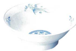
9050537 リム7.0井 ¥1,200 D21.3 H7.6