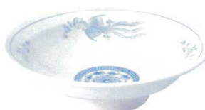
9050177 7.0丸高台皿 ¥1,150 D22 H6.3