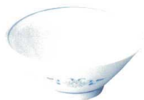
9050252 5.0ライス井 ¥600 D15 H6.5