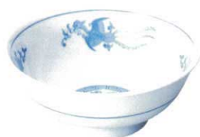
9050133 5.8高台井 ¥800 D17.7 H7.4