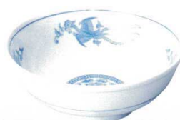
9050235 6.5玉淵井 ¥1,500 D20 H7.7