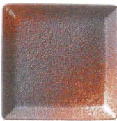
7380661 大文字 14cm角プレート ¥1,150 D14 H2