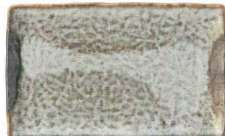
505 1612 山がすみ 串皿大 ¥1,100 L21.3 S13.3 H2