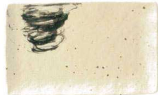
770 1612 風雲 串皿大 ¥1,100 L21.3 S13.3 H2