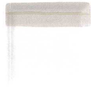
5300661 小雪 14cm角プレート ¥1,150 D14 H2