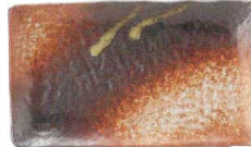
745 1612 明志野 串皿大 ¥1,100 L21.3 S13.3 H2