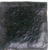
028 1660 のあーる 石目4.3正角皿 ¥630 D13 H3