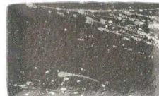
772 1612 吹雪 串皿大 ¥1,100 L21.3 S13.3 H2