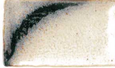
711 1612 銀河 串皿大 ¥1,100 L21.3 S13.3 H2