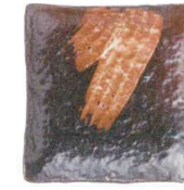
720 1660 白刷毛唐津 石目4.3正角皿 ¥650 D13 H3