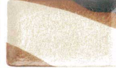
549 1612 新彩雲 串皿大 ¥1,100 L21.3 S13.3 H2