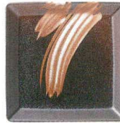
7200661 白刷毛唐津 14cm角プレート ¥1,100 D14 H2