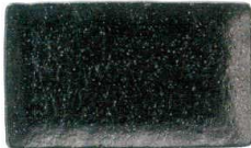
036 1612 星空 串皿大 ¥1,050 L21.3 S13.3 H2