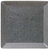
0300661 みかげ 14cm角プレート ¥1,000 D14 H2