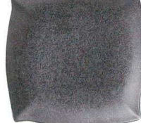
030 3966 星灯り 15cm角皿 ¥1,300 D15 H2.5