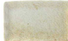
546 1612 のどか 串皿大 ¥1,100 L21.3 S13.3 H2