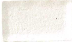
019 1612 新粉引 串皿大 ¥1,050 L21.3 S13.3 H2