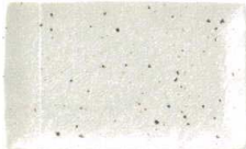
044 1612 雪の花 串皿大 ¥1,050 L21.3 S13.3 H2