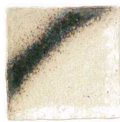
711 1660 銀河 石目4.3正角皿 ¥650 D13 H3