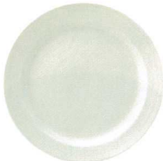
0454510 風蘭 8.0平皿 ¥1,400 D24.8 H2.8 0454508 風蘭 7.0平皿 ¥850 D21.8 H2.7