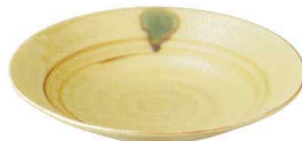
7553110 山吹 リップル8.5皿 ¥1,700 D23.7 H4.5 7553109 山吹 リップル7.5皿 ¥1,100 D25.7 H4.4