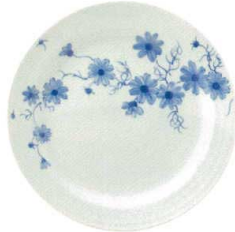
1494510 藍こぼし 8.0平皿 ¥1,550 D24.8 H2.8 1494508 藍こぼし 7.0平皿 ¥950 D21.8 H2.7