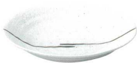
7123110 クラフトライン リップル8.5皿 ¥1,600 D25.7 H4.5 7123109 クラフトライン リップル7.5皿 ¥880 D23.7 H4.4