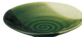
5333110 織部三彩 リップル8.5皿 ¥1,650 D25.7 H4.5 5333109 織部三彩 リップル7.5皿 ¥1,050 D23.7 H4.4