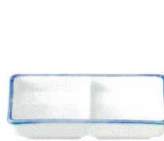
7601000 呉須ライン スタック2連皿 ¥750 L11.9 S7.3 H2.2