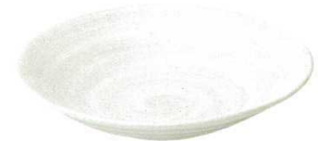
7433110 白萩 リップル8.5皿 ¥1,600 D25.7 H4.5 7433109 白萩 リップル7.5皿 ¥1,000 D23.7 H4.4