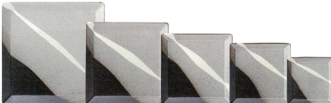
5150668 山かげ 30.5cm角プレート ¥5,500 D30.7 H1.8