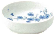
1494526 6.0深鉢 ¥900 D17.5 H5.1