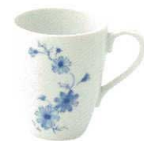
1494550 マグカップ ¥880 L10.7 S7.5 H9.5(230cc)