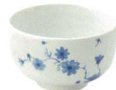
1494533 小丼 ¥730 D12.1 H7.3