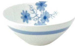
1494544 6.0盛鉢 ¥1,150 D18.3 H7.5