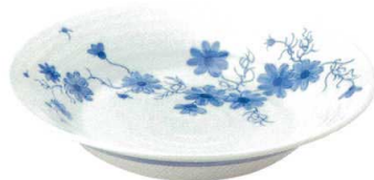
1494559 8.5鉢 ¥2,200 D26.3 H4.8