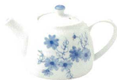
1494580 ポット ¥3,300 L18 S11 H11(550cc)