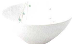
1504544 6.0盛鉢 ¥1,200 D18.3 H7.5