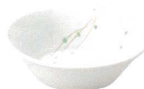
1504554 5.5鉢 ¥780 D16.7 H5