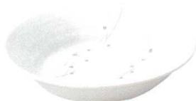
1504557 7.0鉢 ¥1,450 D21.3 H4.5