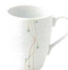
1504550 マグカップ ¥930 L10.7 S7.5 H9.5(230cc)