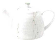
1504580 ポット ¥3,400 L18 S11 H11(550cc)