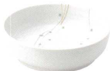
1504526 6.0深鉢 ¥950 D17.5 H5.1