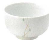
1504533 小丼 ¥780 D12.1 H7.3