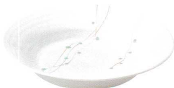
1504559 8.5鉢 ¥2,300 D26.3 H4.8