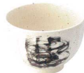
770 2923 けずり十草4.8丼 ¥950 D14.8 H10.5