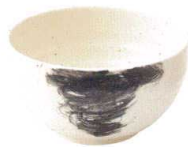
770 1536 石目5.5丼 ¥1,800 D17 H9.5