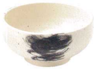
770 1630 石目高浜5.5丼 ¥1,200 D17.5 H8.5