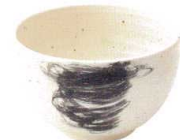
770 1545 石目深口5.0丼 ¥1,500 D15.9 H9.5