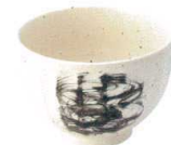
770 2922 けずり十草4.2丼 ¥750 D12.5 H8.4