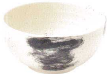
770 1537 石目6.0丼 ¥2,400 D19.5 H9.6