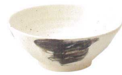
770 2938 6.8けずり丼 ¥1,800 D20.5 H8.3