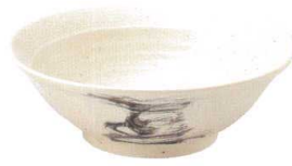
770 2941 8.0けずり丼 ¥3,000 D24.5 H8.5