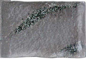
756 1643 石目8.0長角皿 ¥2,800 L26 S17.5 H2.8