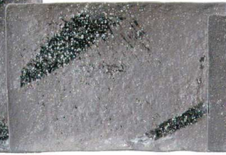
756 1645 石目9.5長角皿 ¥3,900 L29 S19 H3