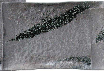
756 1646 石目尺長角皿 ¥4,600 L31.7 S21.5 H3.5