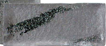
756 1654 石目尺細長角皿 ¥2,400 L31 S13.3 H2.8