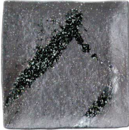
756 1668 石目9.0正角皿 ¥3,350 D27.5 H4.5