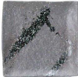
756 1665 石目7.0正角皿 ¥1,500 D22 H3.7