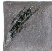
756 1662 石目5.0正角皿 ¥780 D15 H3