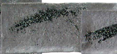
756 1655 石目尺一細長角皿 ¥2,800 L35 S15 H3