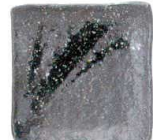
756 1660 石目4.3正角皿 ¥680 D13 H3