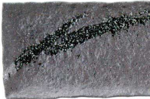
756 1659 石目尺四細長角皿 ¥3,900 L42 S17.5 H3.3