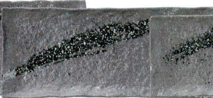
756 1657 石目尺三細長角皿 ¥3,300 L39 S16.5 H3