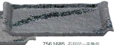
756 1685 石目尺一平角皿 ¥4,950 L33.3 S20.5 H3.3