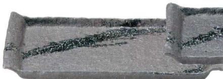
756 1687 石目尺二平角皿 ¥7,000 L37.5 S22.3 H3.5