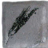
756 1663 石目6.0正角皿 ¥900 D17.5 H3.7