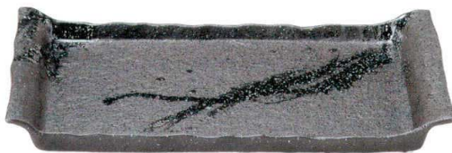
756 1689 石目尺四平角皿 ¥10,000 L42 S27 H4.5