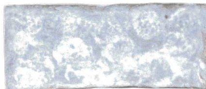
759 1655 石目尺一細長皿 ¥3,100 L35 S15 H3 759 1654 石目尺細長皿 ¥2,600 L31 S13.3 H2.8