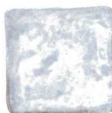
759 1660 石目4.3正角皿 ¥750 D13 H3