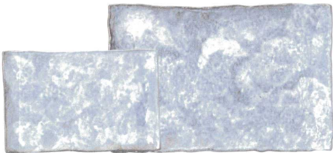
759 1643 石目8.0長角皿 ¥3,050 L26 S17.5 H2.8 759 1645 石目9.5長角皿 ¥4,200 L29 S19 H3