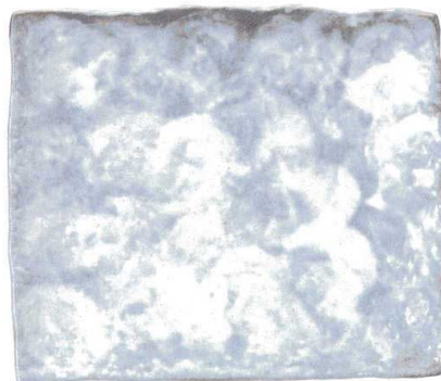
759 1683 石目尺一盛皿 ¥6,200 L33 S27.8 H3.8