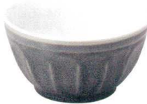
5412932 面取5.5井 ¥1,350 D16.2 H8.8