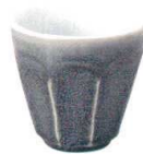
5412974 けずりマルチカップ ¥700 D9.5 H9(300cc)