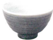
5412945 けずり茶漬井 ¥950 D13.2 H8.4