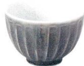
5412922 けずり十草4.2井 ¥750 D12.5 H8.4