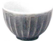
5412923 けずり十草4.8井 ¥930 D14.8 H10.5