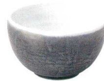
5411545 石目深口5.0井 ¥1,650 D15.9 H9.5