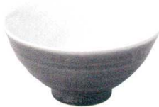
5412950 けずり種井 ¥1,150 D17.2 H8.8