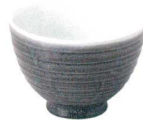
5412552 千段5.0井 ¥1,500 D15.0 H10.7