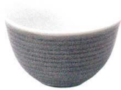
5412542 櫛目4.8井 ¥900 D14.4 H8.9