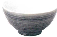
5412554 千段5.5井 ¥1,700 D17.2 H9.2