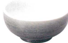
5411630 石目高浜5.5井 ¥1,250 D17.5 H8.5