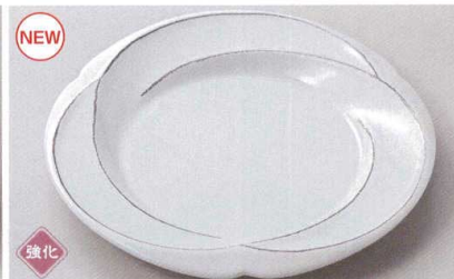
103-302-35 2,850円 プラチナスリーリング21cm皿(21.6×2.5) 610330235