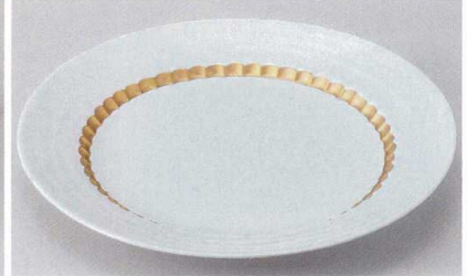
103-103-34 3,700円 白磁金彩リム8.0皿(23.5×3) 510230334