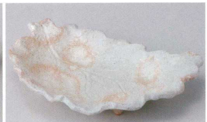
103-503-81 1,500円 粉引8.0葉型平皿(25×17×4) 520330481