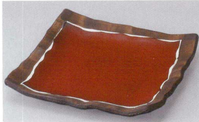
103-101-35 4,000円 うるし風正角8.0皿(24.8×24.2×4) 510210335