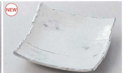
103-403-61 2,600円 粉引三枚重正角皿(19.4×19×4.6) 610340361