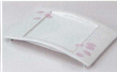
103-202-5 3,300円 ラスター弓型皿(26×16.7×3.5) 510250205