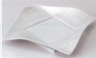
103-102-8 3,900円 パールラスター7.5盛鉢(22.5×22.5×4) 510220108