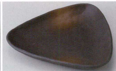
103-402-25 2,600円 備前三角皿(大)(23.5×23.5×4) 520310225