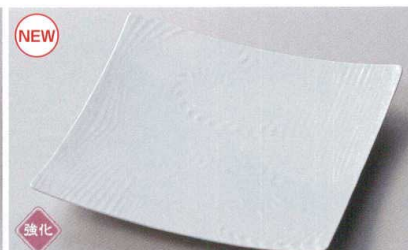
103-502-34 1,680円 (強化)白磁レリーフ6.0角皿(19×19×3.3) 610350234