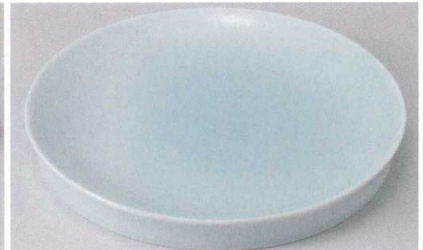
103-203-34 3,200円 青白磁8.0ハイプレート(24.5×3) 520340234