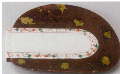
103-301-35 3,100円 錆軸赤絵変形皿(22.5×20.5×2.5) 510120135