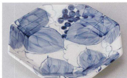
103-501-35 2,360円 ぶどう絵瀬戸呉須八角和皿(18.9×18.9×1.8) 520240235