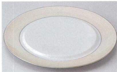
103-201-34 3,550円 測金ラスター高台プレート(25.5×1.8) 510310234