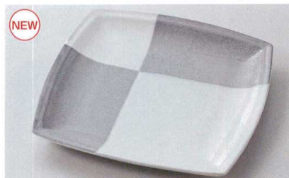
103-401-78 2,700円 黒化粧塗分け角皿 大(22.5×22.5×2.1) 610340178