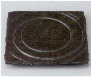
104-201-30 4,800円 黒条紋四方皿(17×17×1.8) 510010430