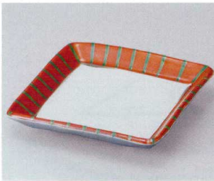
104-301-7 3,900円 赤十草四方皿(16×16) 510230107