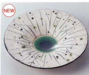
104-401-35 2,750円 内織部筋十草6.0皿(21.5×4) 610440135