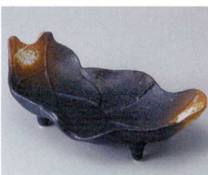
104-501-51 2,300円 黒備前双葉盛鉢(26.5×15×7.5) 521020351