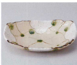
104-502-5 1,950円 山茶花漬物皿(22.2×15×5) 520230105