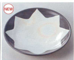
104-504-34 1,500円 御本手粉引掛分丸6.5皿(20.2×3.7) 610450434