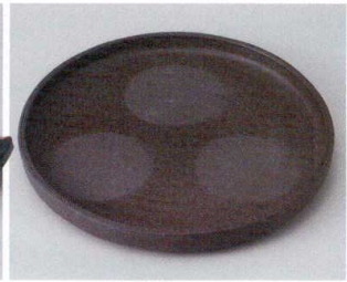
104-204-5 3,150円 炭化土切立7.5皿(22.1×2.8) 510130305