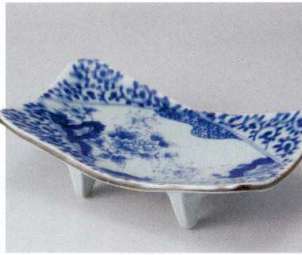
104-202-34 4,500円 染付岩牡丹まな板高台皿(27.5×15.5×8) 510030234