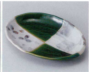
104-304-74 3,100円 織部市松小判盛皿(25.5×18.8×3.5) 520810174