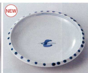
104-503-25 1,700円 染付深皿(17.3×2.8) 610450325