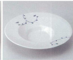
104-303-35 3,250円 ルリ唐草渦6.5皿(23.7×4) 510350335