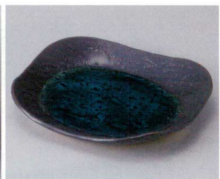
104-404-60 2,500円 海碧角浅鉢(大)(手造り)(24×19×4.3) 520320260