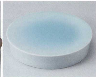
104-105-34 4,950円 青白磁水面8.0高台皿(24×5) 510140134