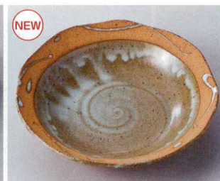
104-403-74 2,500円 舞璫土7.0深皿(21.7×4.8) 610440374