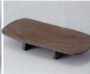
104-104-35 5,200円 手造り荒土暖色まな板皿(31×14.5×5.5) 510140235