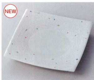
104-402-35 2,750円 ラスター点紋正角皿(18×18×3) 610440235