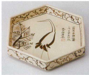
104-302-34 3,650円 乾山鶴絵六角皿(17.5×20×3.4) 510120234