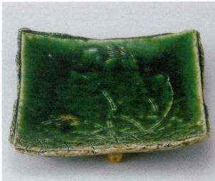
104-101-7 5,600円 オリベスキ手造正角6.0皿(18×18) 510010107 104-102-7 4,050円 オリベスキ手造正角5.0皿(13.5×13.5) 510010207