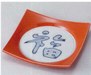
108-502-30 1,850円 柿釉福四方皿(大)(17×17×3.2) 510830330