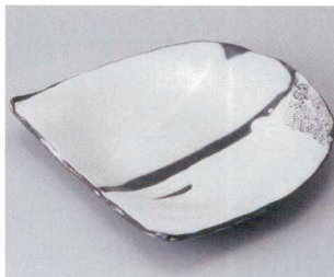
108-303-26 2,400円 粉引三鳥変形和皿(18.5×18×3) 510640226