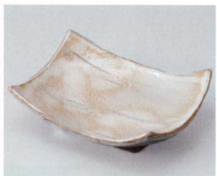
108-404-79 2,800円 粉引あけぼの多用皿(19.5×15.5×5.5) 510510379