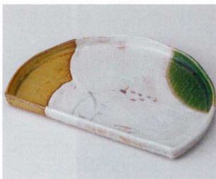
108-402-70 1,660円 三彩芦半月皿(20.5×14.9×1.6) 510910171