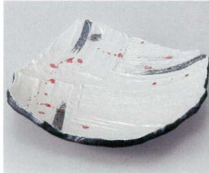
108-102-25 2,800円 ラスター紅梅6.5寸皿(19×19×4) 510510425