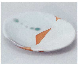
108-504-16 3,200円 白マットフルーツ皿(20.7×17.6×2) 510410116