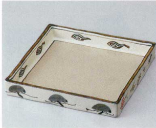
108-101-5 3,200円 乾山正角鉢(18×18×2.5) 510410205