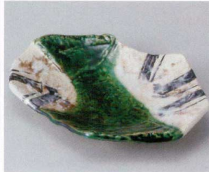
108-103-31 2,500円 織部錆絵変型7.0皿(22×16×3.8) 510610331