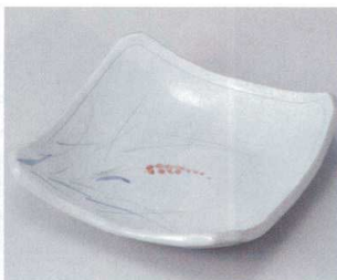
108-503-5 1,900円 粉引手彫芦7.0四方皿(17.8×17.8×4) 510830205