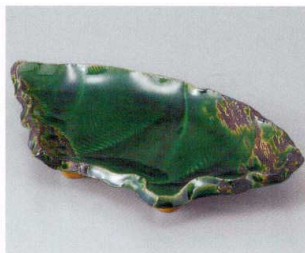
108-203-24 3,500円 織部波紋扇皿(24×13×4) 510320324