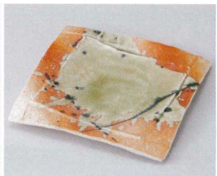
108-304-35 2,400円 伊賀四辺皿(18×18×2) 510650235