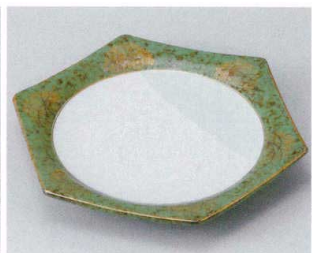
108-204-34 2,480円 グリーン武蔵野六角皿(17.7×20.5×3) 510620434