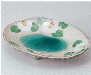
108-301-30 2,900円 白椿楕円和皿(23.5×18×4) 510450330