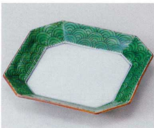
108-401-34 2,450円 交趾青海波隅切皿(16×16×2.5) 510630434