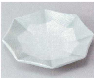
108-201-25 2,500円 銀彩波彫八角7.0皿ヒワ吹(19.5×19.5×2.8) 510620125