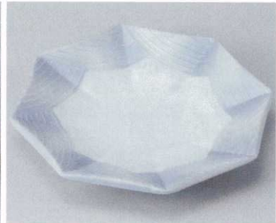
108-104-25 2,500円 銀彩波彫八角7.0皿コバルト吹(19.5×19.5×2.8) 510610425