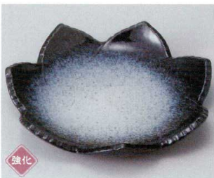
108-501-74 1,950円 雲海葉型6.0皿(18.2×3.2) 510810374