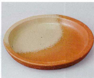
108-403-34 2,700円 伊賀風掛分切立7.0皿(20.5×2) 510530134