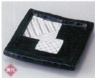
109-201-30 2,500円 黒織部砂目5.5皿(17×17×3.4) 510720130