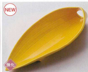
109-503-5 1,850円 黄釉笹舟7.5前菜皿(23.5×8.8×4.5) 610950305