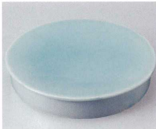
109-202-25 2,800円 青磁6.5中高台皿(19.2×3.8) 510520125