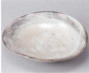
109-102-7 2,350円 粉引クシ目楕円6.0皿(19.5×18×4.5) 510710107