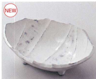
109-401-61 2,350円 粉引彫21cm鉢(21.5×15.7×6.7) 610940161