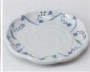
109-104-78 2,300円 唐津7.0丸皿(21.5×2) 510710478