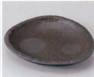
109-203-5 2,850円 炭化土縄測6.3皿(20.9×18.4×3) 510520205