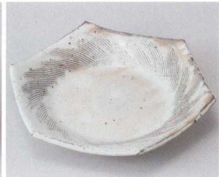
109-204-34 2,250円 粉引クシ目六角皿(19.5×17.5×3.4) 510720434