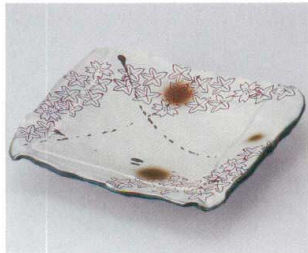
109-301-5 2,800円 粉引赤絵春秋6.5盛皿(19.8×18.5×3.5) 510510105