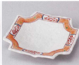
109-403-5 2,100円 赤絵隅切皿(18×18×3) 510740305