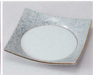
109-404-34 2,150円 潤金グリーン吹正角皿(17×17×3) 510740434