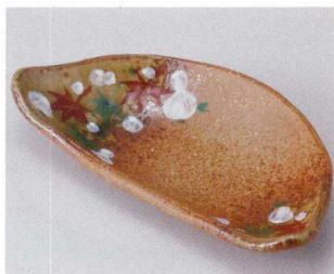
109-501-34 1,650円 伊賀紅葉半月皿(20×10×3.6) 510850434