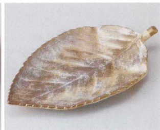
109-504-35 2,280円 木の葉金タタキ焼物皿(21×12.3×3) 510720235