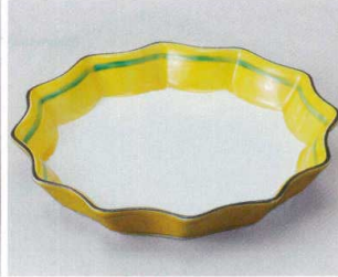
109-103-35 3,300円 黄交趾12角変り皿(18.5×18.5×3) 510340235