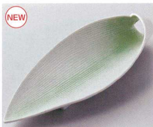
109-502-35 2,150円 ラスター変り舟前菜皿(23×9.5×5.5) 610950235