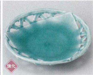
109-304-34 2,150円 深海青磁カコメ6.3皿(19×3.5) 510730434