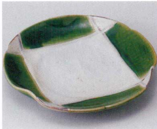
109-302-78 2,100円 織部格子三ツ押中皿(18.3×3.5) 510750278