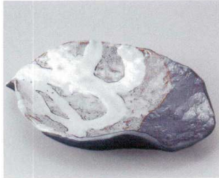
109-101-16 2,900円 新雪変型皿(21×18×4.2) 510440316