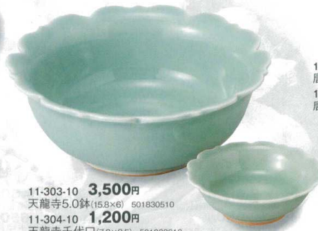
11-303-10 3,500円 天龍寺5.0鉢(15.8×6) 501830510 11-304-10 1,200円 天龍寺千代口(7.8×2.5) 501830610