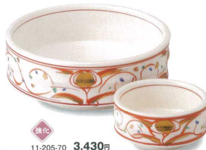
強化 11-205-70 3,430円 赤絵華紋刺身鉢(14.1×5.4) 501930371 11-206-70 1,220円 赤絵華紋千代口(7.8×3.8) 501930471