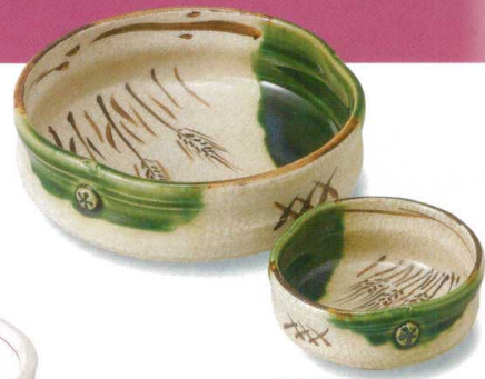
11-203-70 3,750円 両織部麦紋向付(13.3×5.5) 501820171 11-204-70 1,600円 両織部麦紋千代口(8×3.8) 501820271