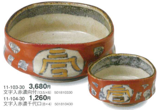
11-103-30 3,680円 文字入赤濃向付(13.5×6) 501810330 11-104-30 1,260円 文字入赤濃千代口(8×4) 501810430