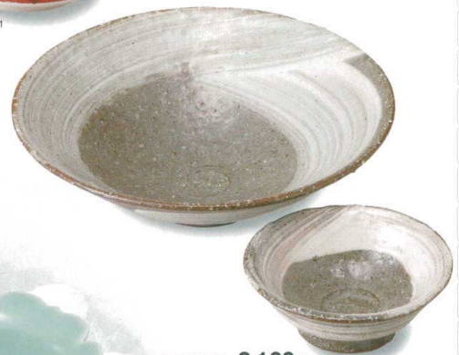
11-305-34 3,160円 唐津刷毛目反方向付(17×5) 501910134 11-306-34 1,150円 唐津刷毛目千代口(9×3) 501910234