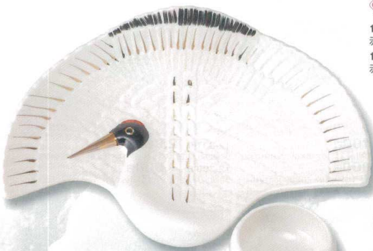
11-301-34 3,370円 高麗つる型向付(20.5×14×5.5) 501830334 11-302-34 440円 高麗丸千代口(6×3) 501830434