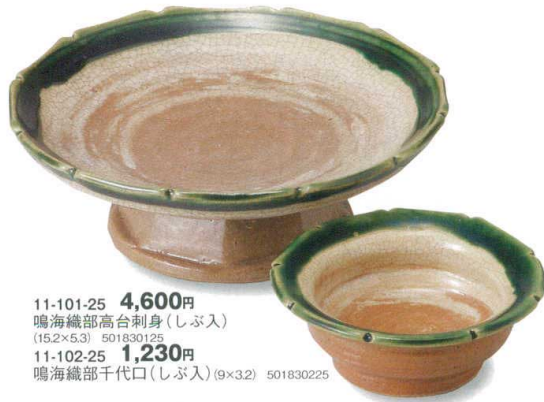
11-101-25 4,600円 鳴海織部高台刺身(しぶ入) (15.2×5.3) 501830125 11-102-25 1,230円 鳴海織部千代口(しぶ入)(9×3.2) 501830225