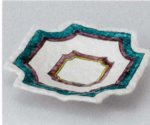
110-103-5 2,750円 三彩交趾隅切皿(18×18×3) 510520305