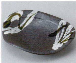
110-501-51 2,100円 鉄黒乱線紋変型6.5皿(20×18.3×4.2) 510750151