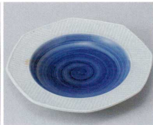
110-504-7 1,530円 カイヘキリム八角皿(22×2.8) 510920207