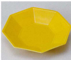
110-404-34 1,750円 黄釉八角皿(17.7×19×3.2) 510840134