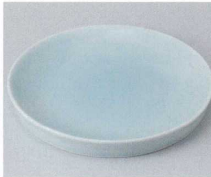
110-303-34 1,880円 青白磁6.5ハイプレート(19.6×2.3) 510850134