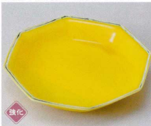
強化 110-502-73 1,700円 黄交趾八角多用皿(17.8×3.8) 510840373