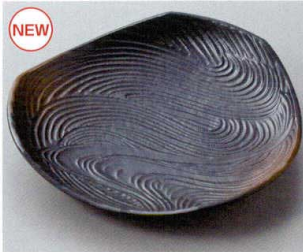
NEW 110-102-47 2,860円 やきしめ流水7.0三角皿(21×3.5) 611010247