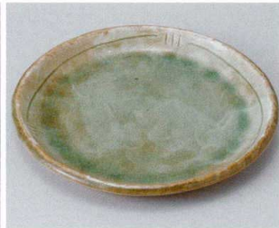
110-304-78 1,800円 緑彩貴入7.0丸皿(20.5×2.5) 510830178