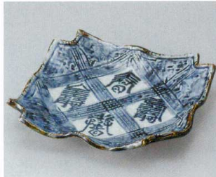
110-101-30 3,000円 隅切兵須漢詩入6.5皿(19×19×3.6) 510440130