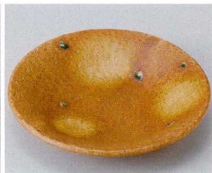
110-405-31 1,690円 南蛮吹水玉6.0深皿(19.2×4.2) 510850231