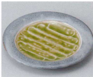
110-203-10 2,000円 ねずみ志野灰釉フルーツ皿(17.4×2.3) 510750140