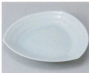
110-401-5 1,850円 蒼デザート皿(20.7×20.7×2.8) 510820305