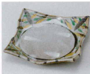
110-201-34 2,350円 唐津三色十草盛皿(17.5×4.5) 510650434