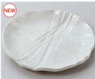
NEW 110-202-35 2,000円 ワラ丸皿 大白磁(20.5×20×3.2) 611020235