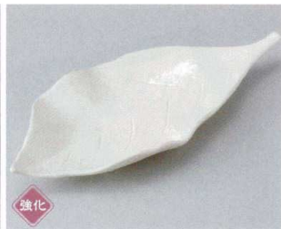
強化 110-204-78 2,050円 クリーム葉型焼物皿(28.5×12.5×3.5) 510750378