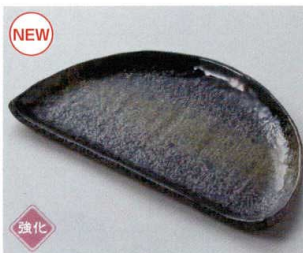
NEW 強化 110-402-73 1,800円 黒緑彩半月8.0皿(24.5×14.6×2.3) 611040273