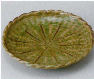
110-302-34 1,900円 灰釉ザル型7.0皿(20.5×3) 510820234