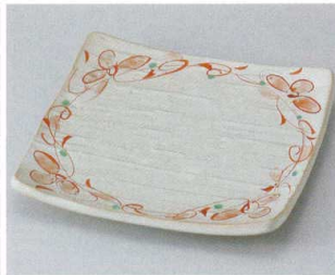
110-301-34 1,980円 粉引花唐草正角皿(17×17×2.5) 510820434