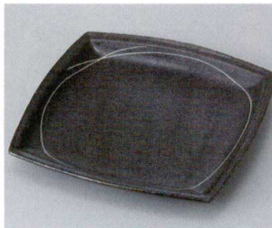
110-503-73 1,500円 黒化粧彫結び角皿(中)(18×18×2.1) 510920173