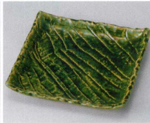
111-303-5 1,250円 織部削ぎ角取皿(17×17×2.5) 510940105