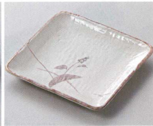
111-504-79 450円 ヨシ正角皿(15.8×15.8×2.5) 611150479