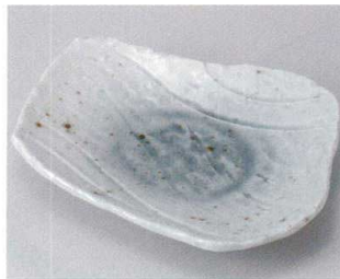
111-501-28 1,020円 湖畔前菜皿(21.5×16.4×3.8) 510950328