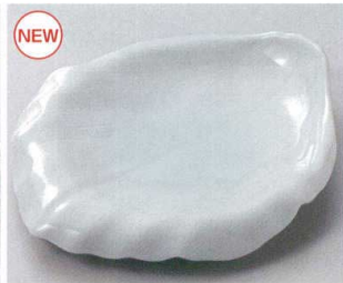
111-403-51 1,100円 青白磁芭蕉形前菜皿(20×16.5×3.5) 611140351