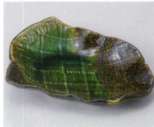
111-301-58 1,200円 深緑もえぎタタラ皿(21.5×17×3.5) 520330158