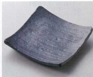
111-503-15 950円 黒結晶足付5.5角皿(16.5×16.2×3.8) 611150315