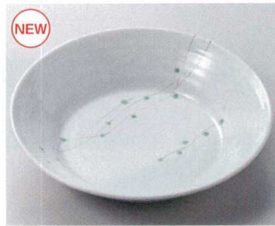
111-201-33 1,450円 芽吹き7.0深皿(21.3×4.5) 611120133