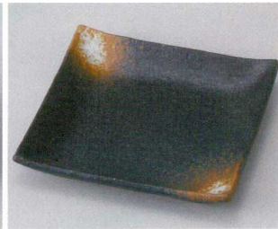
111-404-51 1,050円 黒備前正角中皿(17.2×17.2×2) 510950251