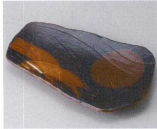
111-101-35 1,500円 月山荒瀬型焼物皿(26×17×3) 510920335