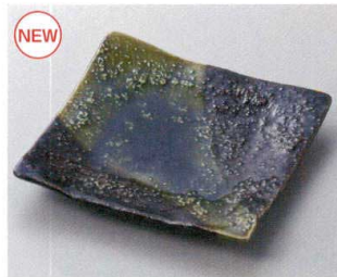
111-401-35 1,150円 天の川華正角皿(18×17.5×3) 611140135