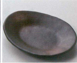
111-104-15 1,450円 備前風マルチプレート中(20.5×15.8×3) 611110415