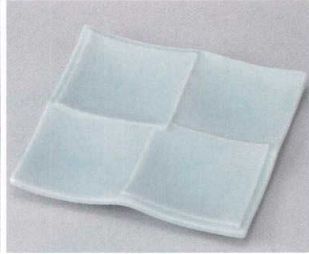
111-103-24 1,500円 青白磁正角四品皿(16.5×16.5×2) 510920424