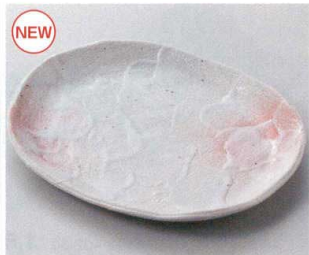
111-402-16 1,100円 桜志野タ円たたら皿(21.2×17.2×2.2) 611140216