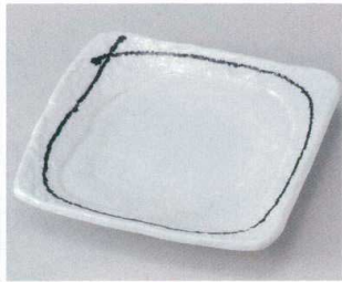
111-202-51 1,350円 黒結び石目正角皿(18×18×2.8) 510930351