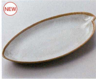
111-102-25 1,500円 伊賀化粧花型長皿(30×15×3.2) 611110225