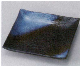
111-502-73 1,000円 青雲7.0正角皿(17×17×2) 510950473