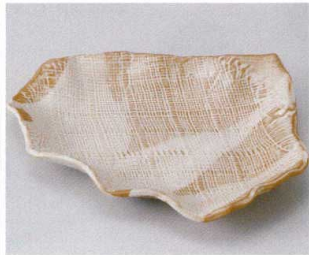
111-302-62 1,200円 もえぎタタラ鉢(21×18×3.5) 510940462