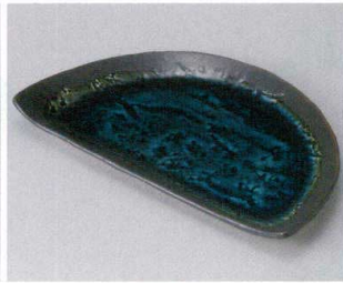
111-203-60 1,280円 海碧半月皿(手造り)(22.5×14.2×2.3) 510930460