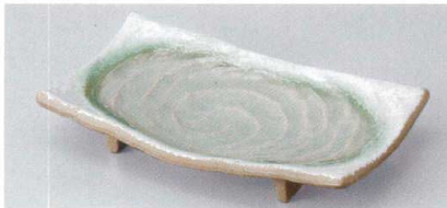
115-501-34 1,950円 グリーン吹ウス付出皿(18.5×10.5×4) 511330234