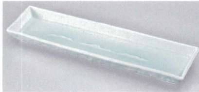
115-301-30 2,100円 青白磁さざ波11.0長角皿(34×9.5×3.3) 511310130