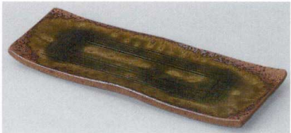
115-403-60 1,950円 灰軸掛付出皿(手造り)(20.7×8.3×1.2) 511320260