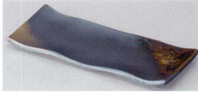
115-201-25 2,300円 いぶし金彩付出皿(21.5×8.8×1.8) 511240125