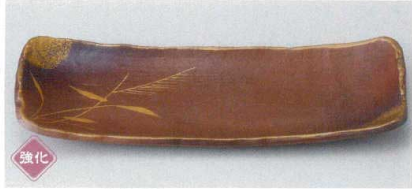
115-103-74 2,300円 秋の詩付出皿(23.2×9×2) 511110274