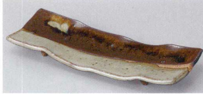
115-101-75 2,500円 掛分唐津 付出皿(23.5×8×3) 511230175