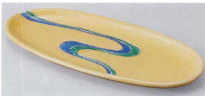
115-601-73 1,730円 二色流水(黄)付出皿(24.3×10.5) 511350273