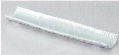
115-402-35 2,100円 青白流紋付出し長皿(33×7.5×3.2) 511260235