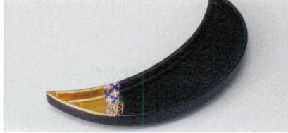
115-102-5 2,400円 天目金彩三日月前菜皿(24.3×6.8×2) 511110105