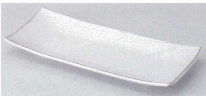
115-602-74 1,700円 白樺長皿(26.5×10.8×2.6) 511350174