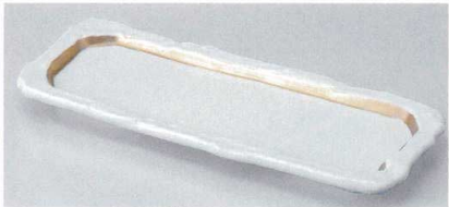
115-303-34 2,100円 金彩ガタ彫長角付皿(24.2×9.3×2.3) 511310234