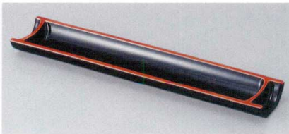
115-502-74 1,850円 塗分赤黒突出皿(31.3×5.8×2.4) 511330374