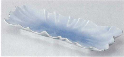
115-203-35 2,200円 コバルト吹ウエーブ長皿(29.2×10×3) 511250235