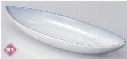
115-302-70 2,160円 潤金ブルー前菜鉢(22.8×7×3.6) 511250371