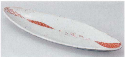
115-503-56 1,800円 赤絵流紋付皿(29×9×2) 511340256