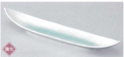
115-603-25 1,700円 青白磁舟形9寸前菜皿(27×5×3.6) 511360125