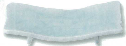
強化 122-303-70 3,100円 青白磁9.0まな板焼物皿 (24.3×11.8×3.7) 512040177