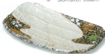
122-402-5 2,400円 南蛮吹春秋焼物皿 (19.7×11.5×3) 512110105