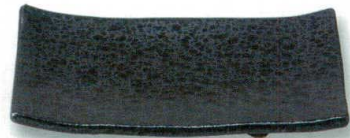
122-103-16 4,300円 油滴天目四ッ足焼物皿 (20.8×13.2×4) 512020216