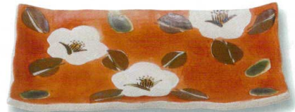
122-203-70 3,540円 赤濃山茶花焼物皿 (24×13.5×2.6) 512010171