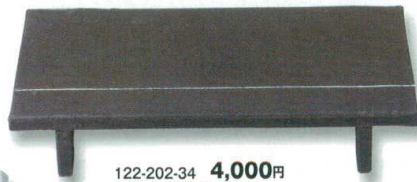
122-202-34 4,000円 炭化土粉引まな板皿 (29×14.6×5.3) 512150234