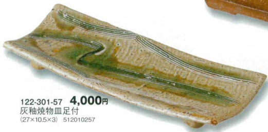
122-301-57 4,000円 灰釉焼物皿足付 (27×10.5×3) 512010257