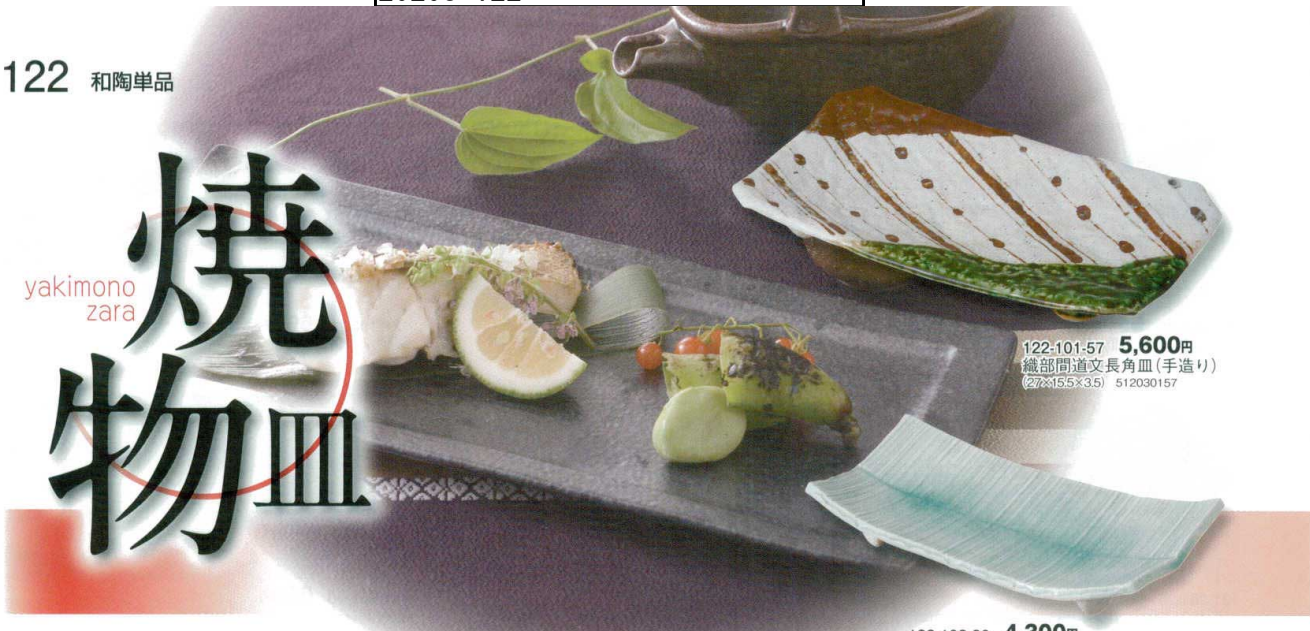
122-101-57 5,600円 織部間道文長角皿(手造り) (27×15.5×3.5) 512030157