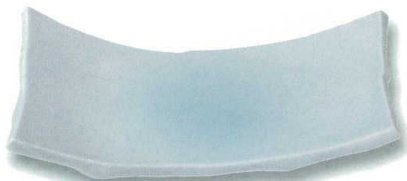
122-201-34 4,300円 青白磁井桁8.5長角皿 (25.5×16×5.2) 512120334