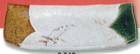
123-301-70 2,540円 三彩芦焼物皿 (25.7×12.9×3.3) 512140171