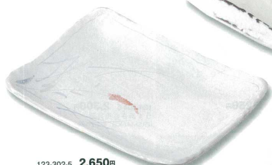
123-302-5 2,650円 手彫芦長角9.0皿 (24×17×2.5) 512210205