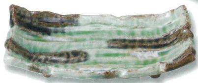
123-101-35 3,250円 ビードロ焼物皿 (24×13×5.2) 512110235