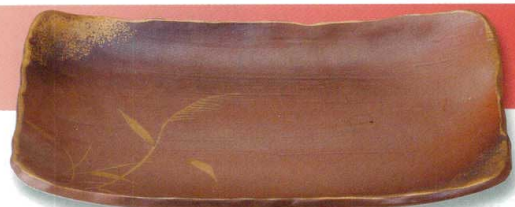
強化 123-202-74 3,500円 秋の詩9.0長角皿 (23.5×17×2.8) 512050174