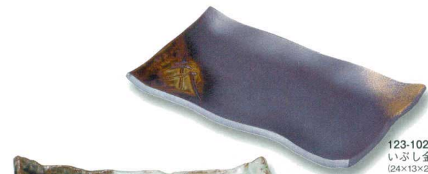
123-102-25 3,200円 いぶし金彩焼物皿 (24×13×2.2) 512120225