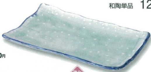
強化 123-201-78 3,100円 御深井9.0長角皿 (27×15.3×3.8) 512130378