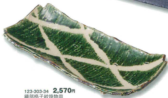
123-303-34 2,570円 織部格子紋焼物皿 (27.3×12×4) 512210334