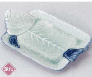
125-502-74 1,680円 御深井魚型焼物皿(22×14.3×3.2) 512350374