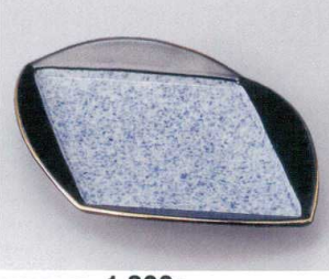
125-402-73 1,800円 吹墨ヒシ型焼物皿(23×16×3.3) 512330573