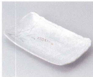
125-301-5 1,850円 手彫芦長角8.0皿(23.5×14×3) 512320505