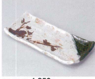
125-302-5 1,100円 手彫芦長角7.0皿(19.5×12.5×2.5) 512320605