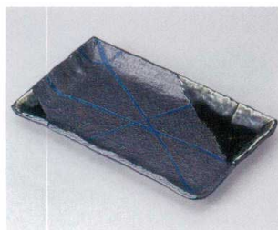
125-201-70 1,940円 南蛮乱十草9.0長角皿(26.4×16×2.3) 512320171