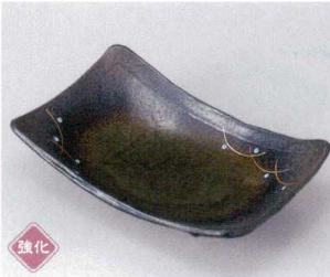
125-102-73 2,050円 金彩むさしの浜付6.0長角皿(19×11.5×4.2) 512250373