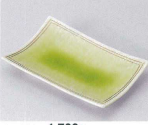
125-403-34 1,700円 ヒワ金線焼物皿(18×11.3×3) 512350234