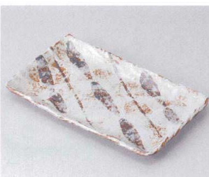
125-202-46 1,900円 志野ストライプ9寸長角皿(26.5×16×2.3) 512320246