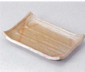
125-303-30 1,850円 火だすきガタ彫焼物皿(21.5×14×3.4) 512340230