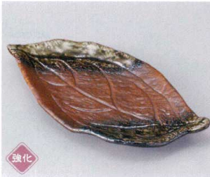
125-103-5 2,000円 南蛮オリベ木の葉皿(23.7×12.5) 512310305