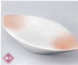
125-104-78 1,930円 あけぼの多用皿(23.5×12×3.8) 512310477