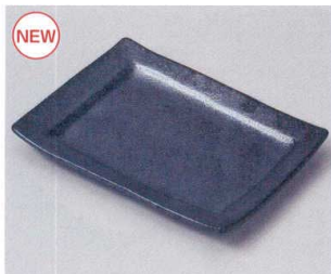
125-501-57 1,250円 黒銀彩 焼物皿(19×13.5×2) 612550157