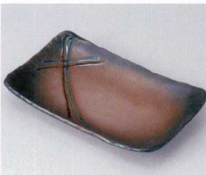
125-304-73 1,920円 流星8.0焼物皿(23.5×14×3.3) 512320373