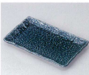
125-204-74 1,850円 紺細9.0長角皿(26.5×15.9×2.5) 512330274