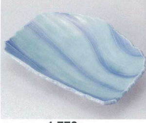
125-404-34 1,770円 青磁流水彫7.0皿(22×16×4) 512340434