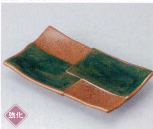
125-306-70 1,820円 南蛮市松8.0焼物皿(21.3×12.7×3) 512330477