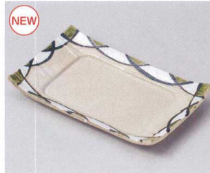
125-101-73 2,150円 白い波7.5長角四方皿(22×13.5×3.2) 612510173