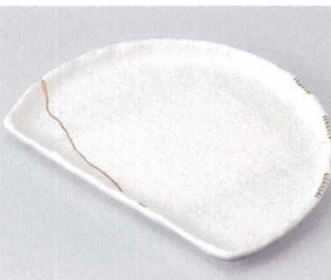
125-503-74 1,750円 月と川半月焼物皿(20×14.5×2.2) 512340374