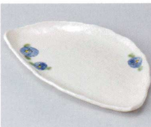
128-201-78 1,200円 粉引山茶花半月焼物皿(24×15×1.8) 512630478