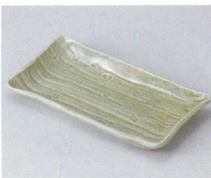
128-301-74 1,100円 緑釉7.0長角皿(深口)(20.5×11.6×2.5) 512730174