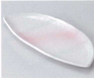
128-102-78 1,320円 彩時空・夢9.0半月皿(29.7×12.5×2.2) 512620177