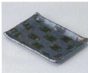
128-303-46 1,100円 黒市松7.0長角皿(20×14×2.7) 512720146