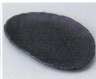
128-504-81 960円 いぶし半月皿(24×16.5) 512750481