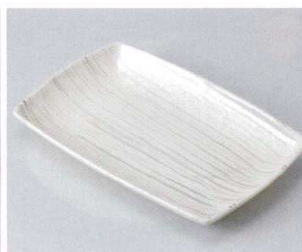
128-503-78 1,000円 粉引ハケメ焼物皿(22×14.5×2.8) 512750378