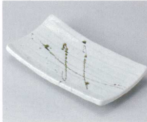
128-103-78 1,150円 筆流し四つ足焼物皿(22×12.5×3) 512710178