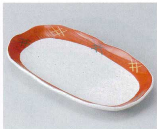
128-204-56 1,100円 赤帯焼物皿(22×12.8×2.4) 512710456