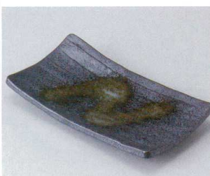
128-501-51 1,050円 南蛮Nライン焼物皿(21.7×12×3) 512740251