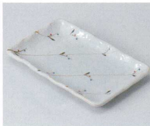
128-203-74 1,100円 志野芽生7.0焼物皿(20.2×12.5×1.8) 512720374