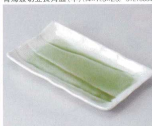
128-502-35 1,000円 うのふエメラルドグリーンソギ焼物皿(24.5×14.4×2.5) 512750135