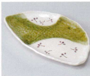
128-202-78 1,100円 緑彩小花半月焼物皿(24×15×1.8) 512730278