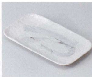
128-302-78 1,100円 志野茶刷毛焼物皿(24×13.5×2) 512710378