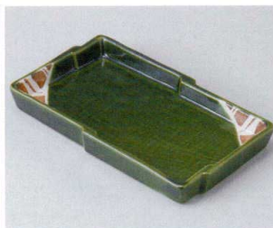
128-402-40 1,100円 青海波切立長角皿(大)(21.8×12×2.5) 512730440