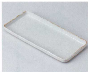
128-304-25 1,100円 黄化粧土切立28cm長角皿(28×13×2) 512740425