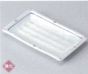
強化 128-101-70 1,440円 測赤絵6.0長角皿(17.6×10.8×1.9) 512440571