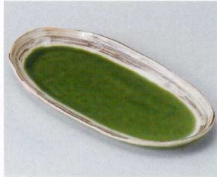
128-104-78 1,250円 織部刷毛目長皿(26×13×1.6) 512640178