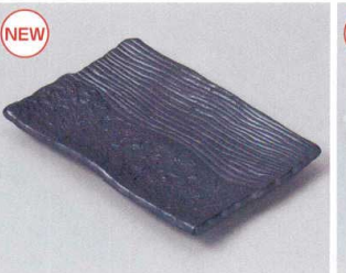
129-504-61 740円 黒薬焼物皿(20.7×14×2.6) 612950461