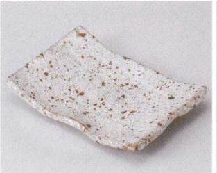
129-302-74 940円 樹水四ツ足皿(16.7×11.6×2.5) 512810474