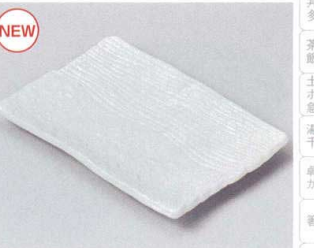
129-505-61 740円 白薬焼物皿(20.7×14×2.6) 612950561