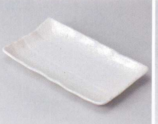
129-103-62 1,000円 白釉ソギ焼物皿(25×14.5×2) 512810262