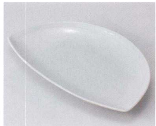
129-201-78 950円 粉引ライン半月焼物皿(25.5×16×2.3) 512840178