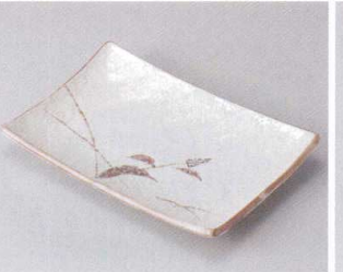
129-303-78 920円 志野アソギ焼物皿(21×14.5×3) 512830278