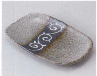
129-501-58 860円 一珍帯唐草長角皿8.0皿(22.8×14.8×2.8) 512850158 129-502-58 620円 一珍帯唐草長角皿6.5皿(19.8×13×3) 512850258