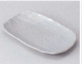
129-503-58 860円 白刷毛目8.0焼物皿(14.7×22.2×2.5) 512850558