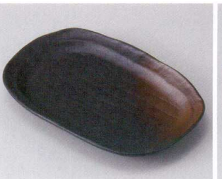
129-203-25 950円 黒備前楕円皿大(24.5×16.2×3) 512820325 129-204-25 650円 黒備前楕円皿小(20×13×2) 512820425