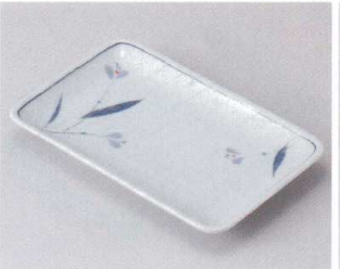
129-402-78 880円 布目小花焼物皿(20.7×13×2.5) 512840378