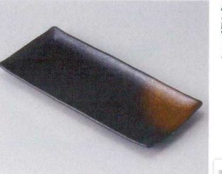
129-104-24 950円 金吹長皿(27.3×12.2×2) 512810324