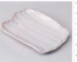
129-205-31 940円 窯変桃山荒ソギ焼物皿(22.5×15×2) 512820631