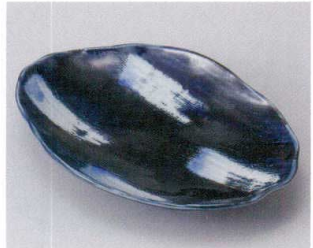
129-401-34 880円 呉須白刷毛目小判皿(22×15×3.5) 512840234