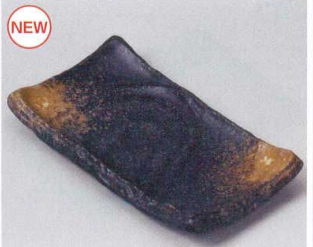
129-102-51 1,200円 黒備前足付焼物皿(小)(21.5×12×3.5) 612910251