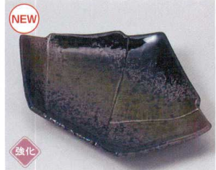
129-101-73 1,400円 黒緑彩結び皿(21.2×14.7×3) 612910173