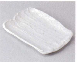
129-202-62 950円 荒ソギ22cm焼物皿(22×15×2) 512820562