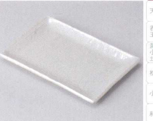
129-304-78 910円 真珠7.0新焼物皿(20×13.2×1.7) 512830478