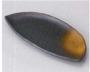
129-301-24 950円 金吹半月皿(27.3×12.7×2.5) 512810124