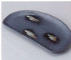
130-501-51 850円 金彩角半月皿(21.8×12×2) 512910251