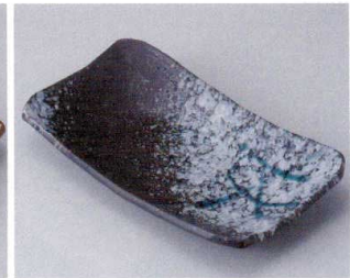
130-504-35 830円 土化粧反り焼物皿(24.8×14.2×4) 512930435