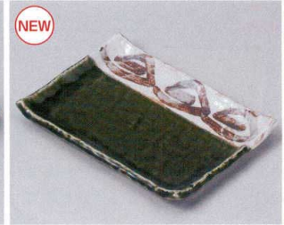
130-104-73 1,230円 織部ライン7.0焼物皿(20.5×14.4×2.2) 613010473