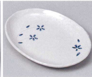
130-303-73 950円 青い花6.0小判皿(18.7×13.3×1.7) 613030373