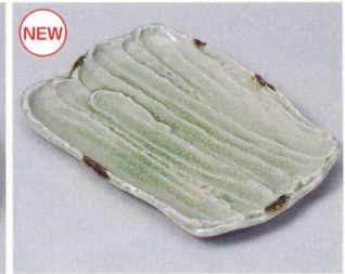
130-304-35 1,050円 笹みどり荒ソギ焼物皿(22×15×2) 613030435