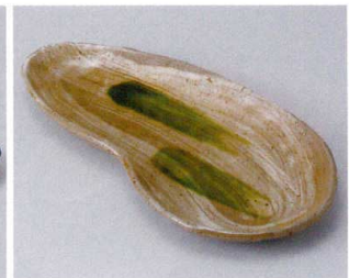
130-404-51 850円 黄瀬戸手押し焼物皿(26×13×2) 512910351