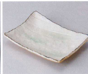
130-502-25 830円 安曇野長角皿(小)(18×13×3.5) 512930325