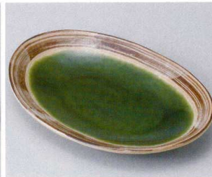
130-302-78 1,080円 織部刷毛目小判皿(大)(20.5×14.5×2.5) 512740378