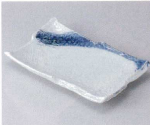
130-101-51 1,290円 清瀬 玄長角皿(21.5×13.4×2.5) 512550351