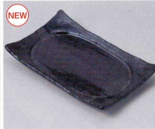
130-102-35 1,250円 風目大和焼物皿(22.2×13.7×3) 613010235