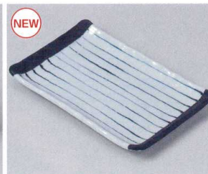
130-403-47 850円 いぶし潤黒十草7.0焼物皿(20.5×13×2.5) 613040347