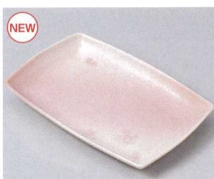
130-201-78 1,250円 ピンク桜焼物皿(22×14.5×2.8) 613020178