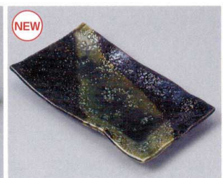
130-204-35 1,150円 天の川華長角皿(24×13.5×3.2) 613020435