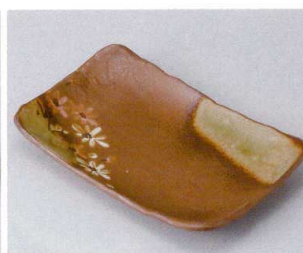
130-202-74 1,200円 南蛮秋桜花7.0焼物皿(19.5×12.5×2.5) 512630174