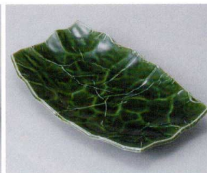
130-402-51 850円 手折りオリベ焼物皿(23×15×3) 512910151