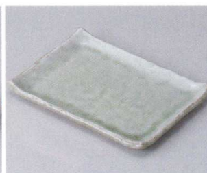
130-203-74 1,180円 白化粧7.0焼物皿(20.5×14.5×2) 512640474