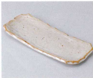
130-301-52 1,150円 うのふ焼物皿(26×10.8×2.3) 512650152