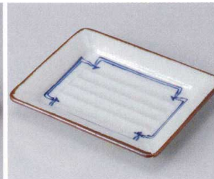
130-503-30 840円 灰釉染付焼物皿(17.6×14.5×2.5) 512930130