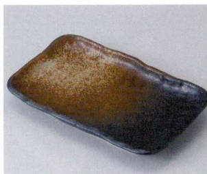
130-401-63 900円 黒備前焼物皿(21×14×2.5) 512950263