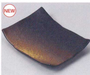
131-303-35 800円 黒備前四ツ足焼物皿(21×16.5×3) 613130335