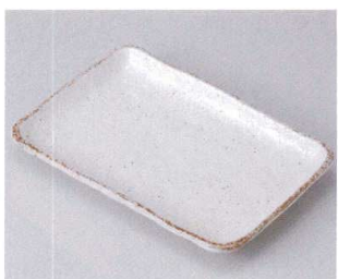
131-401-79 800円 測サビ7.0焼き物皿(20.7×13.7×2.4) 513140479