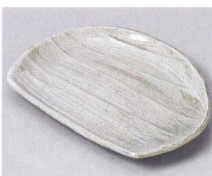
131-503-28 760円 粉引ハケメ 半月皿(22.8×16.8×2.6) 613150328