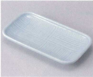
131-102-30 860円 青白磁焼物皿(19.3×10.9×2.7) 512850330