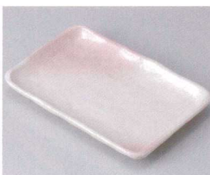
131-404-79 800円 桜志野7.0長角皿(21×14) 512910477