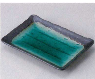
131-403-47 800円 深海グリーン焼物皿(14.5×21×3) 512950347