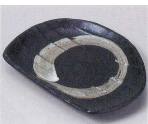
131-502-40 780円 油滴うず湖 半月皿(22.7×16.5×2.5) 613150240