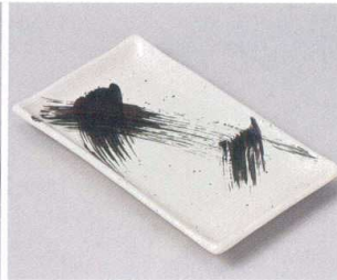
131-104-1 830円 白地黒刷毛焼物皿(21.8×12.8×1.8) 613110401