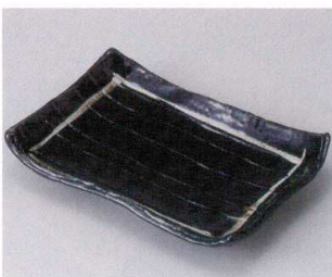
131-202-63 830円 結晶ライン焼物皿(20.5×14×3) 512930263