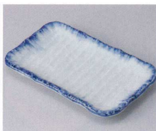
131-304-30 820円 呉須刷毛焼物皿(21.5×13.5×2.6) 513020430