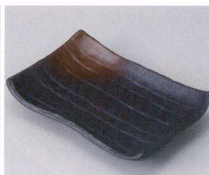
131-204-47 830円 黒備前波型焼物皿(14×20.5×4) 512940147