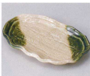
131-405-47 800円 オリベヌリ分け焼物皿(19.5×12.2×2.3) 512950147