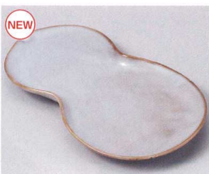
131-302-74 810円 海鼠釉瓢付皿(21.2×12.7×2.5) 613130274