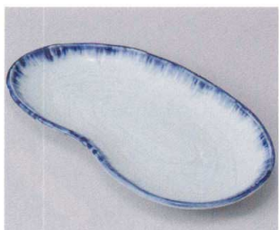
131-301-30 820円 呉須刷毛まゆ型皿(大)(21.5×11.7×1.7) 513030230