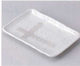
131-103-79 840円 クロス7.0焼物皿(20.7×13.7×2.4) 512920379