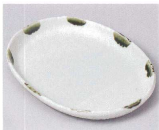
131-201-35 830円 花えくぼ楕円6.5皿(19×15×2) 613120135