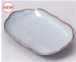
131-101-74 900円 海鼠釉6.5小判皿(18.4×12.9×3.4) 613110174