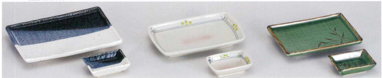
137-301-60 760円 石彩8.0焼物皿(21×14.3×2.7) 513520560 137-302-60 330円 石彩長角千代口(8.3×6×2.5) 513520660