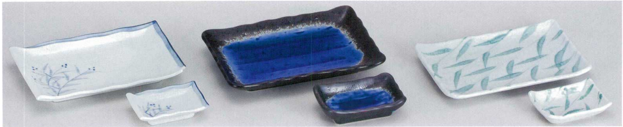
137-101-74 800円 南天7.0焼物皿(19.5×12.7×2.5) 513510374 137-102-74 310円 南天長角千代口(9×6.2×2.5) 513510474