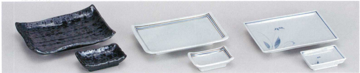
137-201-28 770円 油滴天目焼物皿(20.5×14.5×4) 513520128 137-202-28 380円 油滴天目角千代口(10.7×7×3) 513520228