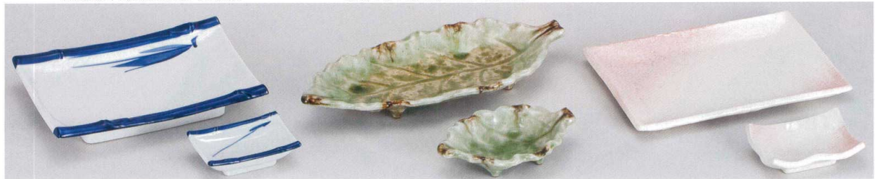
137-401-79 700円 浏竹三ツ笹7.0皿(19.3×13.6×3.3) 513530377 137-402-79 160円 浏竹三ツ笹千代口(8.9×5.7×2.5) 513530477