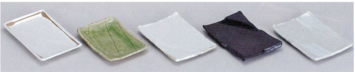
138-501-73 720円 粉引ライン6.0長角皿 (18.4×11.5×2) 513640473 138-502-5 740円 ビードロ長角5.5皿 (16×11×1.5) 513640105 138-503-25 680円 くらま串皿 (16.5×11.5×1.5) 513650225 138-504-51 650円 大和 玄串皿 (17×12×1.5) 513650351 138-505-34 580円 白ハケメ小焼物皿 (17×12×1.6) 513650434