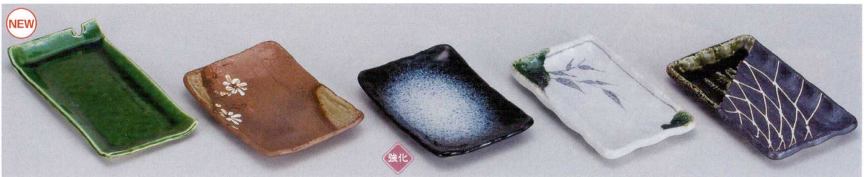
138-201-75 1,800円 織部 串焼き皿 大(19.5×10×2.5) 613820175 138-202-75 1,300円 織部 串焼き皿 小(15×10×2) 613820275 138-203-74 1,050円 南蛮秋桜花5.5長角皿 (16×11.2×2) 513620174 138-204-74 990円 雲海長角5.5皿 (16×11.3×2.2) 513620374 138-205-78 970円 織部芦6.0焼物皿 (17.5×10.5×1.7) 512530378 138-206-70 930円 掛アミ南蛮6.0長角皿 (17.8×10.6×2.1) 513620571