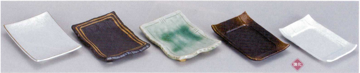
138-101-74 1,100円 白樺5.5焼物皿 (16.7×11.7×3) 513610174 138-102-47 1,100円 黒ライン6.0長角四ツ足皿 (11.7×16.5×2.7) 513610247 138-103-78 1,100円 緑彩貫入6.0四ツ足皿 (17×12×3) 513610378 138-104-73 960円 焼ガ5.5長角四方皿 (16.6×10.1×2.5) 513610473 138-105-73 960円 白磁5.5長角四方皿 (16.2×9.9×2.4) 513610573