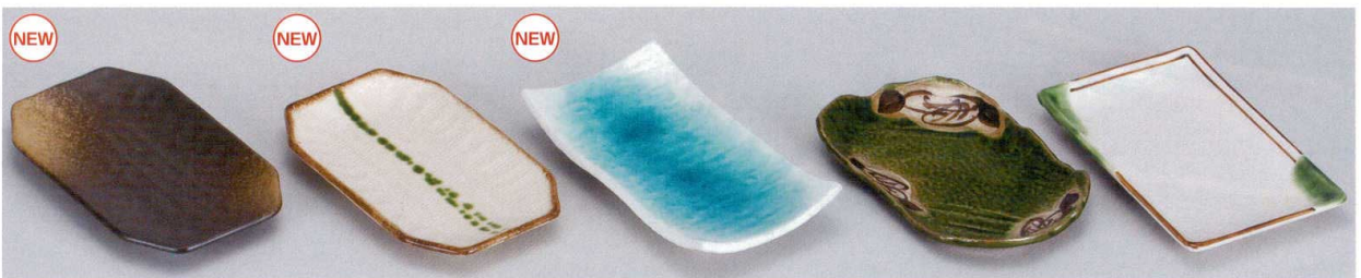
138-401-47 850円 藤次郎八角串皿 (19×11.2×2) 613840147 138-402-47 850円 さわらび八角串皿 (19×11.2×2) 613840247 138-403-47 790円 白流水浜付焼物皿 (19.5×10.5×3) 613840347 138-404-73 750円 織部椿変型焼皿 (18×11.8×2) 513630473 138-405-73 720円 織部6.0長角皿 (18.4×11.5×2) 513640373