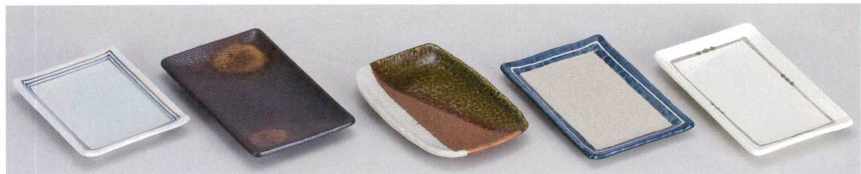
139-301-73 450円 茶ライン長角銘々皿 (15×11.5×2.1) 513720373