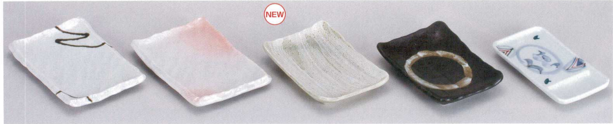
139-101-62 560円 風雅匠串皿 (17.5×12.2×2) 513650562