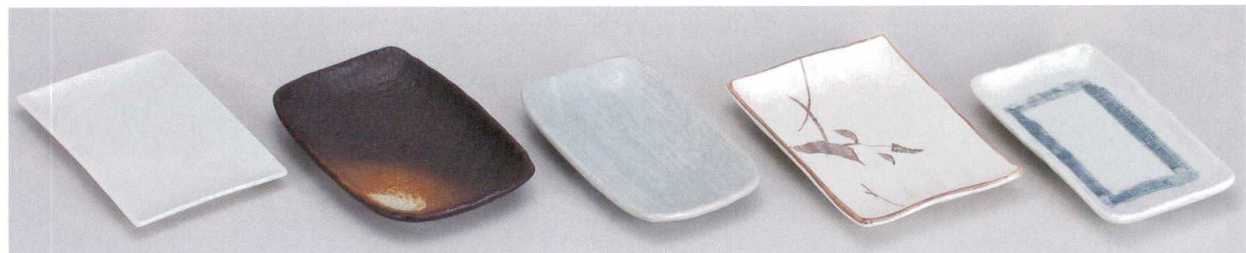
139-401-16 430円 白マット串皿 (15.8×10.5×1.5) 513720516