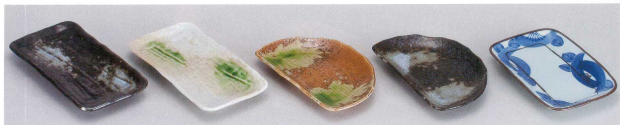
139-501-61 330円 そぎ型串皿 天目 (18.2×9.8×2) 513750561