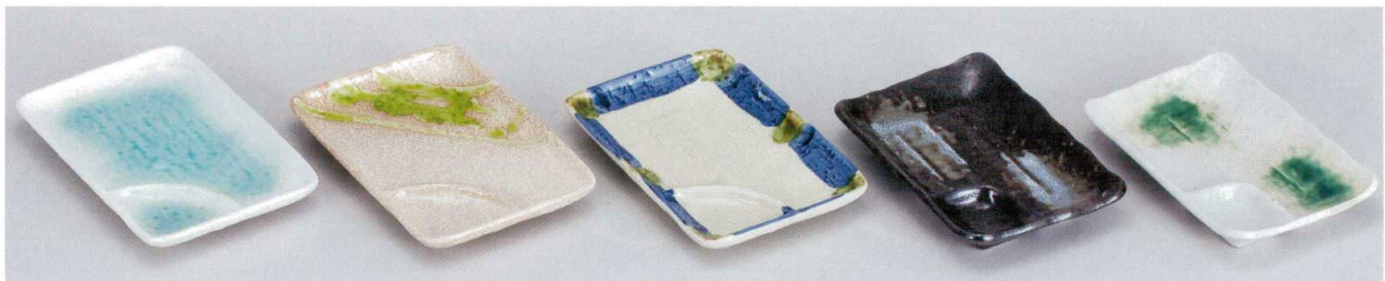
140-501-79 400円 白流水6.0仕切皿 (17.5×11.8×2.2) 513840577 140-502-79 400円 ビードロ6.0長角仕切皿 (17.5×11.8×1.8) 513840377 140-503-56 400円 織部6.0仕切皿 (17.7×12×2) 513850356 140-504-61 380円 6.0仕切付皿 天目 (17×11×2.3) 513850561 140-505-61 380円 6.0仕切付皿 織部吹 (17×11.3×2.2) 513850461