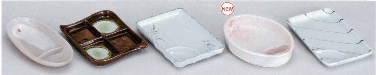
140-101-70 1,330円 刷毛目楽舟型仕切皿 (21.7×10.2×2.3) 513810171 140-102-73 1,230円 オフケ竹型四品盛 (18×14×2.3) 614010273 140-103-73 1,100円 マット萩7.0仕切皿 (19×13×2.7) 513810373 140-104-16 1,100円 桜志野小判千代口付皿 (18.7×24×4) 614010416 140-105-47 920円 ストライプ7.0仕切付長角皿 (20.5×13×2.3) 614010547