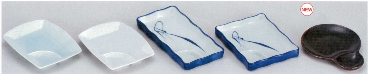
140-201-34 860円 青白磁仕切皿 (18×13.8×2.8) 513810434 140-202-5 860円 白スタックパーティー皿 (18.3×13.9×2.8) 513810505 140-203-40 800円 ゴス巻笹長角仕切皿 (23×11.2×2.5) 513820240 140-204-40 700円 ゴス巻笹長角仕切皿(大) (17.2×13.5×2.5) 513820340 140-205-40 600円 ゴス巻笹長角仕切皿(中) (14.8×11.5×2.5) 513820440 140-206-75 800円 天目 ひさご皿 (19×14.6×2.2) 614020675