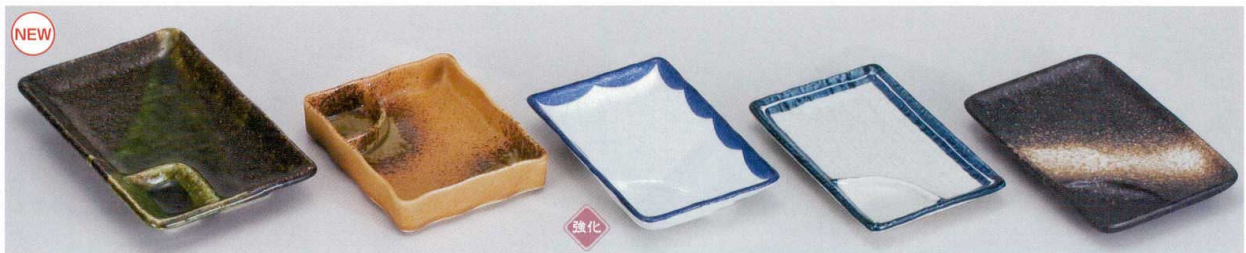
140-401-62 630円 天の川 仕切皿 (21×13×3) 614040162 140-402-61 600円 伊賀織部仕切付皿 (14.6×11.5×3.1) 614040261 140-403-70 630円 波重ね6.0仕切皿 (17×11.5×2.6) 513830471 140-404-74 430円 洩ライン6.0長角仕切皿 (17×11×2) 513850174 140-405-79 430円 黒備前6.0仕切皿 (17.5×12×2.2) 614040579