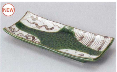
NEW 145-503-35 1,080円 織部山里 サンマ皿(29×12.8×4.1) 614550335