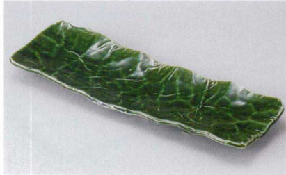
145-101-51 1,300円 手折りオリベサンマ皿(32.5×10.3×3.5) 514250351