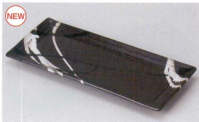
NEW 145-301-62 1,260円 白遊流 六兵サンマ皿(28.5×12.8×2.5) 614530162