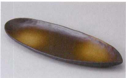
145-501-60 1,150円 うでいりーフさんま皿(33.8×12.7×3) 514330260