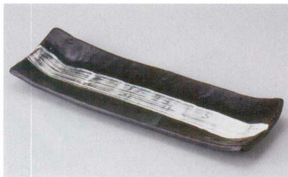
145-201-63 1,300円 一文字10.0たたら皿(32×10.7×2.8) 514320163