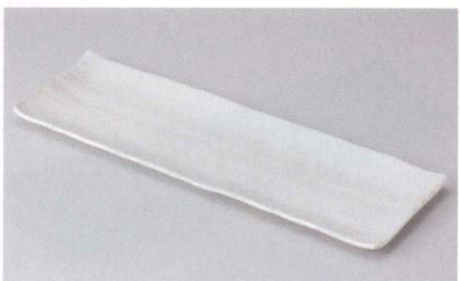
145-303-16 1,200円 クリーム刷毛さんま皿(24.5×11×1.8) 514310216