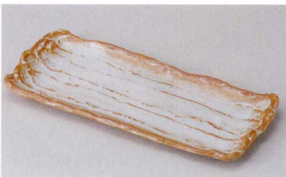
145-402-35 1,200円 赤志野荒ソギさんま皿(29×12×2) 514340235