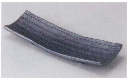
145-203-15 1,300円 黒結晶さんま皿(31.5×10×4.5) 514250215