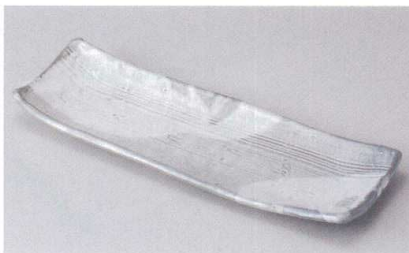
145-202-63 1,300円 白釉流し10.0たたら皿(32×10.7×2.8) 514320263