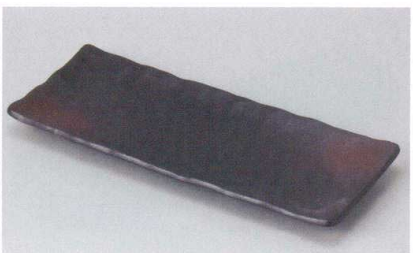
145-403-61 1,200円 備前風 長角皿(28.5×12×2.5) 614540361