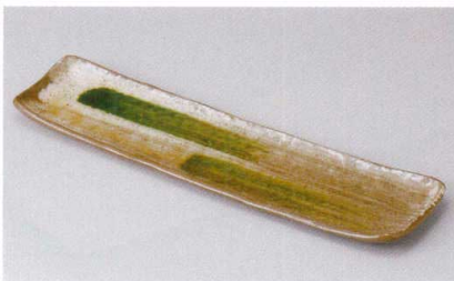
145-302-51 1,250円 黄瀬戸石目さんま皿(38.3×10.2×2) 514310151