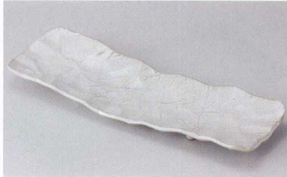
145-102-51 1,300円 手折り粉引ハンテンサンマ皿(32.5×10.3×3.5) 514240251