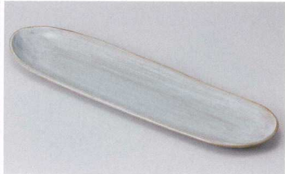
145-103-74 1,300円 刷毛目青雲長皿(37.8×10×2) 514250174