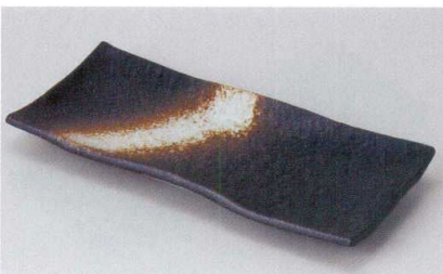
145-502-73 1,150円 黒備前サンマ皿(28×13×3) 614550273