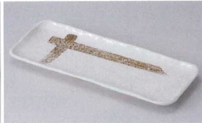
146-503-79 900円 クロスサンマ皿(30×12×2.2) 514430379