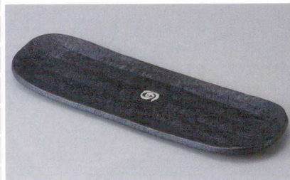
146-401-78 930円 丸紋長皿(黒)(32×10.5×2) 514430178