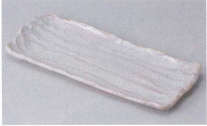
146-103-31 1,020円 窯変桃山荒ソギさんま皿(29×12.5×2.4) 514340331