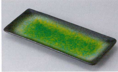
146-102-28 1,030円 有明さんま皿(28.8×12.7×2.8) 514350128