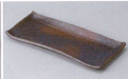
146-502-63 920円 紫備前9.0サンマ皿(28×12×2) 514510163