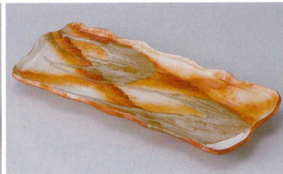
146-402-35 950円 手造りひだすき焼物皿(18.5×13×3) 514420335