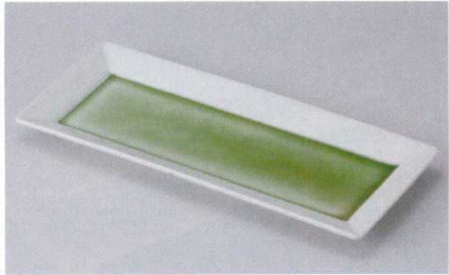
146-203-35 1,000円 うのふエメラルドグリーンスクウェア29cm長角皿(29×12×2.5) 514360235