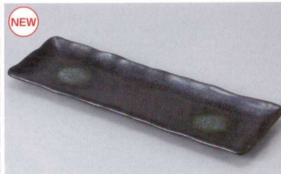
146-301-16 1,000円 黒白吹さんま皿(33.7×11) 614630116