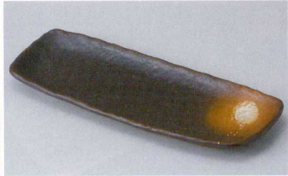
146-303-74 980円 黒備前さんま皿(30×11.7×2.3) 514420174