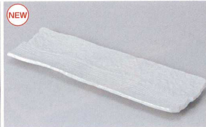
146-302-61 980円 白楽32cm長皿(32.5×10.8×2.5) 614630261