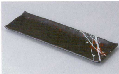
146-201-15 1,000円 潮さんま皿(34.5×11×1.6) 514410215