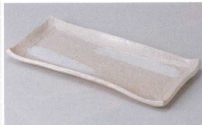
146-501-63 920円 志野備前9.0サンマ皿(28×12×2) 514450163