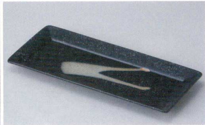
146-403-62 920円 黒流長角皿(29×12.3×2.2) 514430262