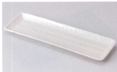
149-401-61 600円 11.0長角皿 白(33.8×10.4×2.2) 514720161