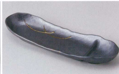
149-203-61 610円 楕円長深口仕切付皿 黒マツト(33×10.3×4.2) 514740261