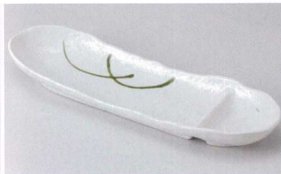
149-202-61 610円 楕円長深口仕切付皿 白(33×10.3×4.2) 514750261