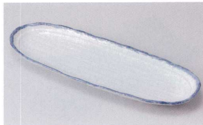
149-301-35 750円 瀏呉須楕円サンマ皿(大)(33.4×12×2.8) 514710235