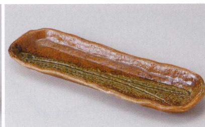
149-503-61 570円 厚瀏長角皿 伊賀(33.3×10.5×3) 514730261