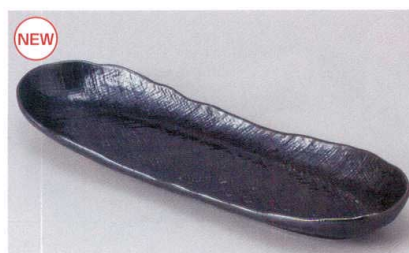
NEW 149-501-61 580円 天目舟長盛皿(33.3×10.7×4) 614950161