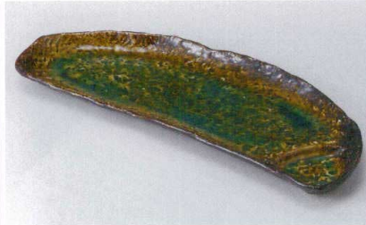
149-102-79 850円 グリーンかすみ仕切付多用皿(31.5×12×2.2) 514650377