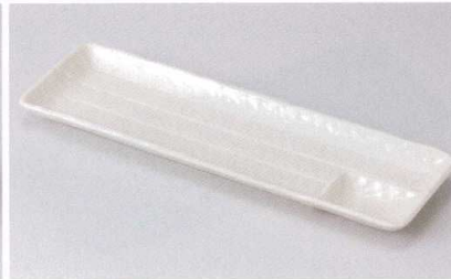
149-303-61 600円 11.0長角仕切付皿 白(33.5×10.5×2.2) 514740361