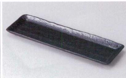
149-402-61 600円 11.0長角皿 天目(33.8×10.4×2.2) 514710361