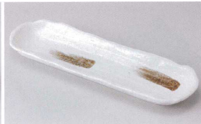
149-403-61 570円 厚瀏長角皿 茶刷毛(33.3×10.5×3) 514730361