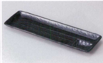
149-302-61 600円 11.0長角仕切付皿 天目(33.5×10.5×2.2) 514750361