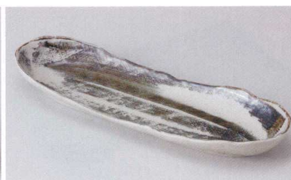
149-502-61 580円 長盛皿藍染(33×10.4×4) 514720261