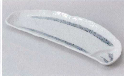
149-103-56 820円 オフケ仕切付多用皿(31.5×12.2×2.1) 514740156