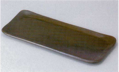
150-301-25 4,000円 黒いぶし長角大皿(35×15.5×2) 514820225