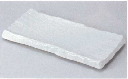
150-501-51 1,780円 白マット荒彫まな板皿(32.3×15.9×3.7) 615050151