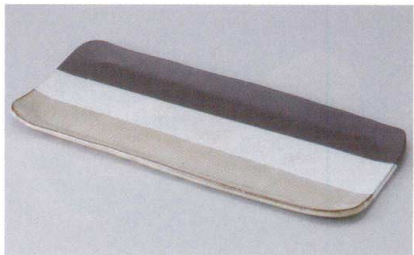
150-201-35 4,550円 半右衛門三色かけ分長角皿(35×15.5×2.5) 514810235