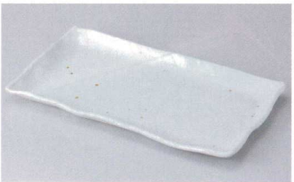
150-402-16 1,800円 くし目梨地長角大皿(31.5×16.8×2) 514850116