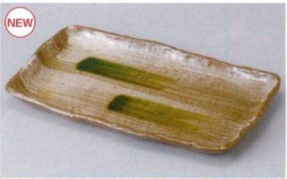
NEW 150-503-51 1,700円 黄瀬戸オリベホッケ皿(31.5×19×2.3) 514910351