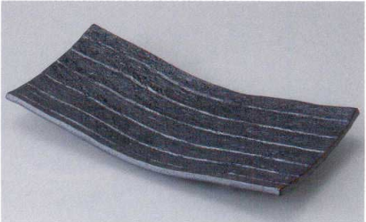
150-303-15 2,300円 黒結晶まな板皿(31×16×4.5) 514840115