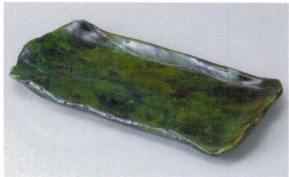
150-101-35 4,800円 手造り織部長皿(35×17×3) 514810335