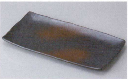
150-401-63 2,000円 紫備前11.0ホッケ皿(34×17.5×2) 514840363