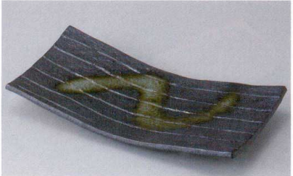
150-302-51 2,550円 南蛮Nライン長角皿(31×16×4.5) 514830351