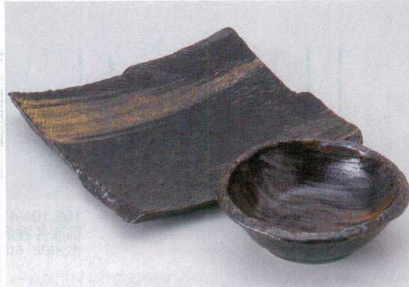
155-103-35 1,280円 加茂川玄19cm正角皿(19.5×19.5×2.8) 515310635 155-104-35 650円 加茂川瀬小鉢(12.5×4.3) 515310735