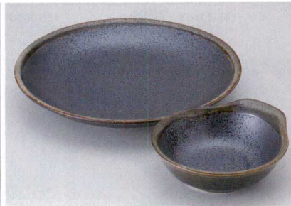
155-303-54 880円 明世黒7.0皿(21.8×3.7) 515340654 155-304-54 650円 明世黒6.0皿(20.4×3.8) 515340754 155-305-54 430円 明世黒香水(13.3×12.2×4.5) 515340854