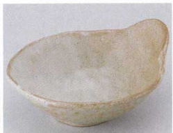
155-502-25 910円 黄化粧毛手付中鉢 (17×14.5×6.6) 515450125