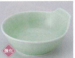
155-503-73 800円 ヒワ香水 (13×12×5.4) 515430371