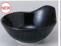
155-504-76 750円 天目香水(大) (14.3×12.8×6.7) 615550476