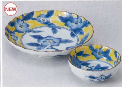
155-306-40 490円 黄彩花紋 6.0皿(19×4) 615530640 155-307-40 320円 黄彩花紋 3.5鉢(10.5×4.3) 615530740