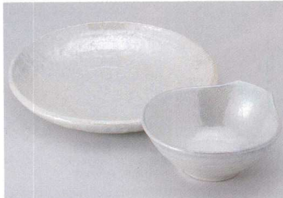
155-101-74 1,220円 真珠7.0丸皿(19.3×3) 515320577 155-102-74 770円 真珠香水(13×12.2×5.3) 515320677