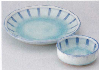
155-203-74 1,150円 早春天皿(20.5×2.5) 515330374 155-204-74 570円 早春香水(10.2×3.4) 515330474