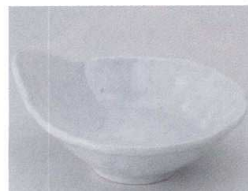
155-501-25 910円 化粧刷毛手付中鉢 (17×14.5×6.6) 515450225