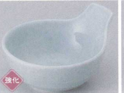
155-404-70 1,100円 青白磁手付香水 (13.7×11.7×7.3) 515420171