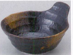
155-403-47 1,130円 やきしめろくべ手付香水(小) (11.5×13.2×6.2) 515460247