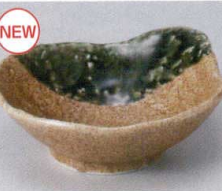
155-505-15 680円 伊賀織部 大香水 (15.7×13.3×4.3) 615550515