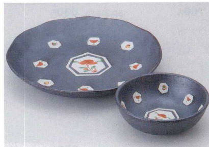
155-301-35 900円 黒釉赤絵小花7.0皿(21×3.5) 515340135 155-302-35 500円 黒釉赤絵小花3.5ボール(11.5×4) 515340235