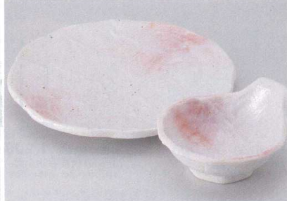
155-105-16 1,200円 桜志野7.0天皿(22×2.7) 515330116 155-106-16 600円 桜志野香水(12.8×11.3×6) 515330216