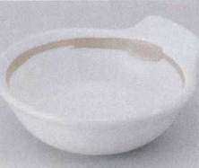
155-405-73 1,000円 粉引ライン香水 (13.5×12.6×5.2) 515420273