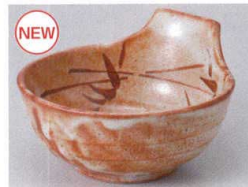
155-401-30 1,750円 赤志野竹 深口香水 (13.5×12.2×7.5) 615540130