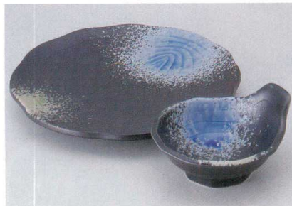
155-201-16 1,200円 磯部70天皿(22×2.7) 515320316 155-202-16 600円 いそへ香水(13×11.5×5.8) 515320416