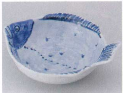
155-402-70 1,550円 呉須魚型香水 (16.5×13.8×5.5) 515410377