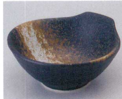
157-101-73 580円 黒備前香水 (12.8×12.3×5.3) 515520473