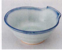
157-203-74 530円 御深井香水 (12.5×12×5) 515520574