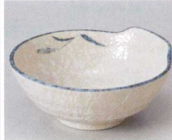
157-103-73 540円 石焼芦香水 (12×11.8×5) 615710373