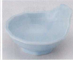
157-305-16 450円 青磁香水 (12.8×11.3×6) 515540516