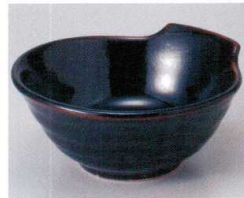
157-401-73 450円 天目香水 (12.5×12.1×5) 615740173