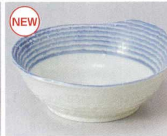
157-503-28 360円 スタイル 香水 (14×13×4.8) 615750328