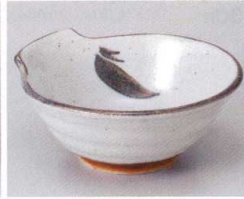
157-202-76 530円 そば香水 (12.7×12×5.5) 615720276