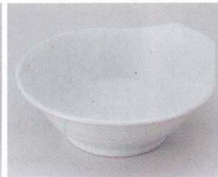
157-502-35 380円 小波白香水 (13.2×12.5×5) 515550435