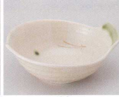
157-205-73 520円 キゼト松葉香水(大) (14.5×5.4) 515530273