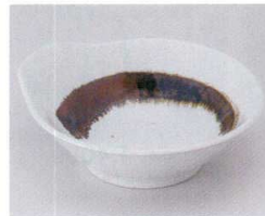
157-501-35 380円 武蔵香水 (13.2×12.5×5) 515550235