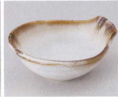
157-505-74 330円 ウノフ香水 (12.5×11.2×4.3) 515560174