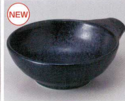
157-104-35 540円 黒結晶香水 (15.5×13×4.8) 615710435