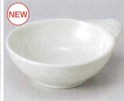
157-105-35 540円 粉引香水 (15.5×13×4.8) 615710535