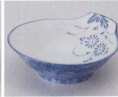
157-605-54 230円 淡雪菊香水 (13×12×4.5) 515560554