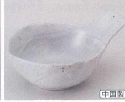
157-204-63 530円 粉引香水 (15.3×11.3×5) 515530163