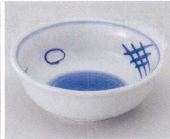
157-303-73 450円 カスリ香水 (12.8×12.3×4.5) 515540273