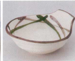
157-504-73 330円 費入カゴメ香水 (12.5×11.5×4.3) 515550573