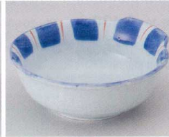
157-304-73 450円 淵十草香水 (12.8×12.3×4.5) 515540173