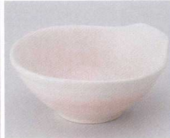
157-102-73 580円 桜志野香水 (12.8×12.3×5.3) 515520373