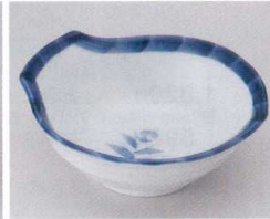
157-404-73 450円 桔梗香水 (12.5×4.9) 515540373