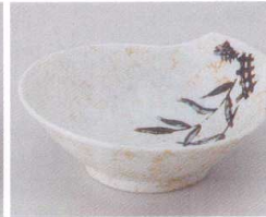
157-604-54 230円 磁器志野香水 (13×12×4.5) 515560354