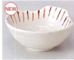
157-201-74 540円 京十草香水(小) (13×12.5×5.2) 615720174