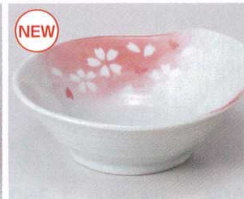
157-602-62 300円 ピンク桜 とんすい (13×12.5×4.5) 615760262