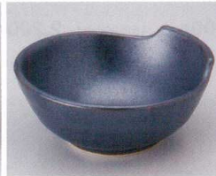
157-302-73 500円 黒マット香水(小) (10.3×10.3×4.5) 515530573