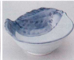
157-402-70 480円 古染ふぐ香水 (12.8×11.8×5.3) 515530371