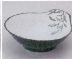
157-603-54 230円 グリーンスキ 香水 (13×12×4.5) 515560454