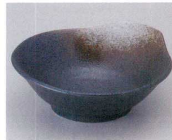
157-601-15 350円 白吹天目香水 (13.5×12.5×4) 515550115