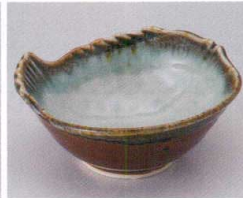
157-403-73 430円 ウノフグ香水 (12.7×12×5.3) 515530473