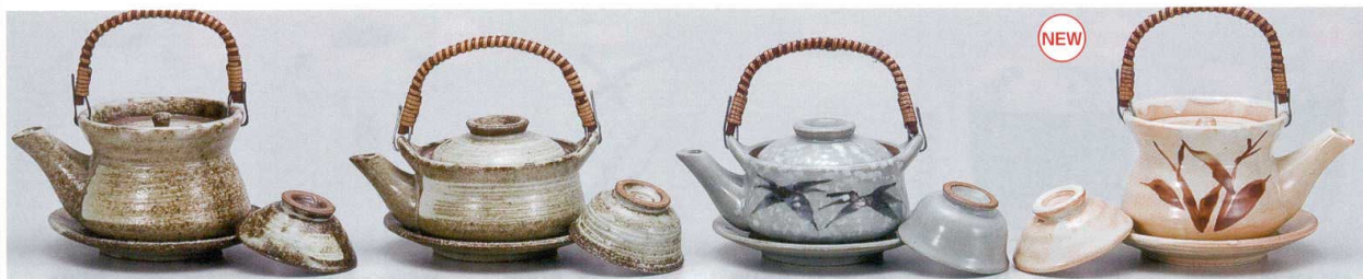
164-401-84 2,800円 ムサシノキネ型土瓶むし(300cc) 516240284 164-402-84 2,800円 ムサシノ切立土瓶むし(260cc) 516240184 164-403-84 2,800円 雪世土瓶むし(260cc) 516240384 164-404-84 2,800円 紅志野キネ型土瓶むし(300cc) 616440484