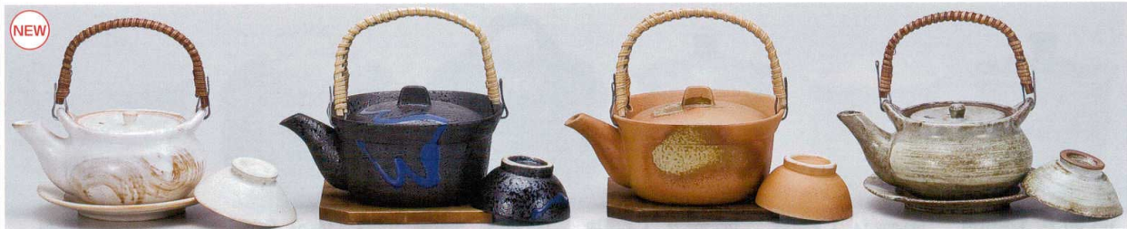
164-301-84 3,000円 耐熱荒波土瓶むし(200cc) 616430184 164-302-7 2,900円 天目青流土瓶むし(270cc) 516220107 164-303-7 2,900円 伊賀吹土瓶むし(270cc) 516220207 164-304-81 2,850円 むさしの土瓶むし(260cc) 516250181