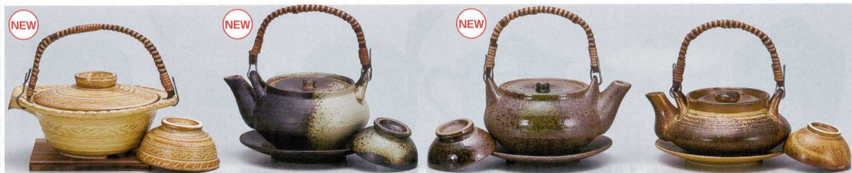
164-501-84 2,600円 耐熱平型土瓶むし(木台付)(250cc) 616450184 164-502-84 2,500円 備前風土瓶むし(320cc) 616450284 164-503-84 2,500円 南蛮織部土瓶むし(320cc) 616450384 164-504-75 2,500円 タタキ 土瓶蒸(240cc) 516220375