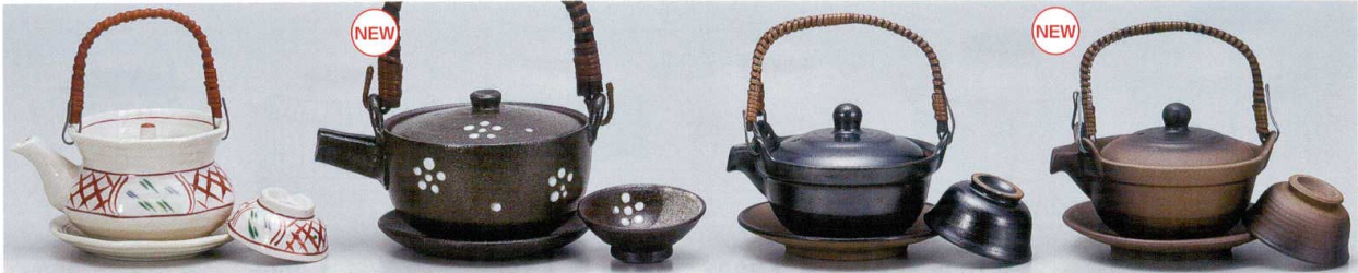
164-101-78 3,650円 手描赤絵土瓶むし(250cc) 516210177 164-102-2 3,650円 梅鉢ダシ土瓶(27.5×8.5) 616410202 164-103-2 1,250円 梅鉢受皿(12.5×1.8) 616410302 164-104-2 560円 梅鉢平盃(7.7×3) 616410402 164-105-84 3,300円 黒袖鍋型土瓶むし(200cc) 616410584 164-106-84 3,500円 焼締鍋型土瓶むし(200cc) 516230284