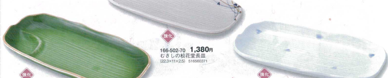
166-501-70 1,380円 緑彩松花堂長皿(23×11.3×2.5) 516560477 166-502-70 1,380円 むさしの松花堂長皿(22.3×11×2.5) 516560371 166-503-78 1,380円 花舞松花堂長皿(23×11.3×2.5) 516450677