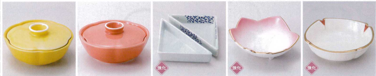
166-201-25 1,500円 黄梅型蓋物(11×3.5) 516430225 166-202-25 1,500円 オレンジ梅型蓋物(11×3.5) 516440225 166-203-78 690円 タコ唐草三角松花堂(10.8×10.8×15.2×2.7) 516410678 166-204-78 690円 青磁三角松花堂(10.8×10.8×15.2×2.7) 516410778 166-205-78 1,380円 ピンクカエデ型鉢(10.8×10×3.7) 516440478 166-206-78 1,500円 測金イチョウ(赤)鉢(11×11×3.3) 516510278