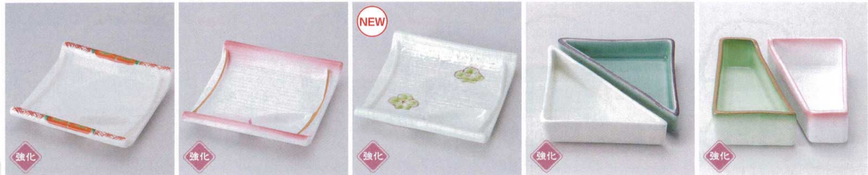
166-101-70 1,270円 赤絵グリーン竹笹仕切皿(11.2×11.1×2.5) 516530571 166-102-70 1,030円 ピンク竹笹仕切皿(11.2×11.1×2.5) 516550171 166-103-70 1,440円 真珠裏り梅竹笹仕切皿(11.1×11.1×2.5) 616610370 166-104-74 690円 トルコ貫入三角松花堂(10.8×10.8×15.2×2.7) 516410474 166-105-74 690円 クリーム三角松花堂(10.8×10.8×15.2×2.7) 516410574 166-106-70 870円 緑彩台形鉢(10.2×6.7×4) 516420171 166-107-70 870円 ピンク吹台形鉢(10.2×6.7×4) 516420271