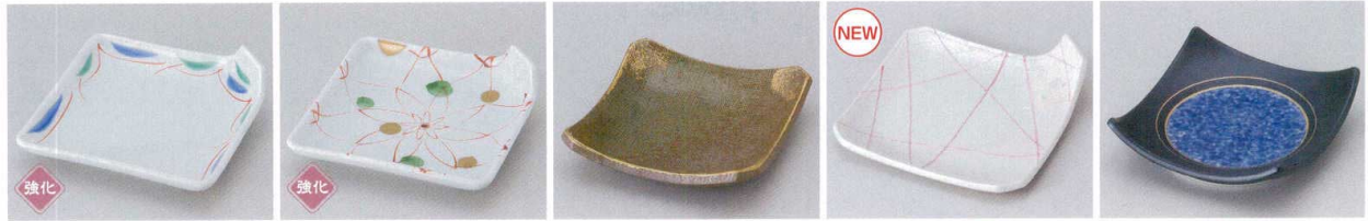
169-101-70 1,440円 赤絵すだれ角折型皿 (10.8×10.8×3.2) 516710371 169-102-74 1,330円 赤絵網角折皿 (10.8×10.8×3.2) 516710477 169-103-74 1,150円 金彩吹織部正角皿 (11×11×2.3) 516710274 169-104-34 1,070円 ピンクー珍ラスター方上り皿 (11.2×11.2×3.5) 616910434 169-105-5 1,080円 吹墨四方上り皿 (11.2×11.2×3) 516720305