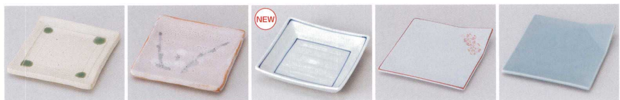
169-401-47 830円 点線丸正角皿 (9.8×1.5) 516740447 169-402-47 790円 桜志野正角皿 (10.5×10.5×1.8) 516750147 169-403-2 780円 四方筋角小皿 (10×10×2) 616940302 169-404-47 800円 桜角皿 (11.2×11.2×1.6) 516730247 169-405-10 750円 トルコ平皿 (11×11) 516750210