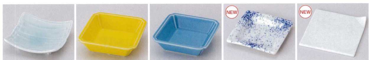
169-501-34 770円 青白磁四方皿(松花堂) (11×11×3) 516740234 169-502-5 720円 黄釉角鉢 (11.5×11.5×3.5) 516760305 169-503-5 720円 トルコ釉角鉢 (11.5×11.5×3.5) 516760405 169-504-51 680円 吹墨正角皿(大) (11×2) 616950451 169-505-60 690円 白磁10cm陶板 (9.9×9.9) 616950560