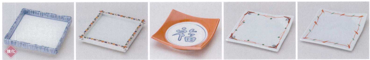
169-201-74 1,050円 呉須刈巻松花堂 (11.2×11.2×2.5) 516920474 169-202-2 1,000円 小花平皿 (10.5×10.5) 516720202 169-203-30 960円 柿袖福四方皿(中) (11.5×11.5×2.6) 516720430 169-204-5 950円 花唐草角皿 (11.2×11.2×1.7) 516730405 169-205-5 950円 花やなぎ角皿 (11.2×11.2×1.7) 516730505