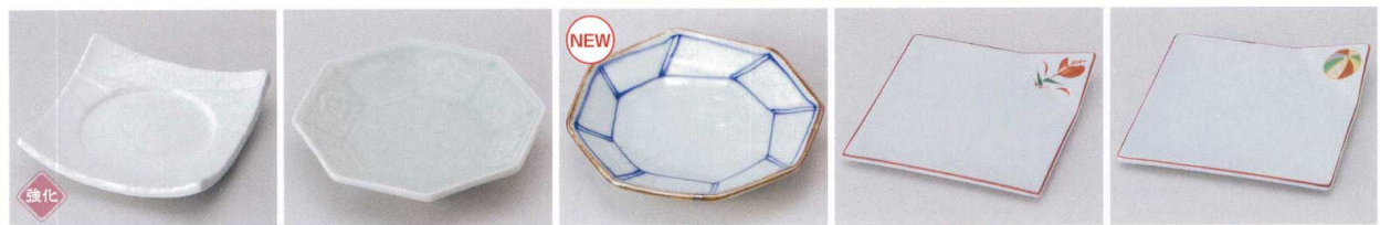
169-301-73 810円 白磁松花堂四方皿 (11.2×2.8) 516730373 169-302-30 820円 青磁八角皿 (12×2.4) 516740530 169-303-34 860円 染付花間取八角小皿 (12×11.5×2.5) 616930334 169-304-47 850円 花ひらり角皿 (11.2×11.2×1.6) 516730147 169-305-47 850円 夢風船角皿 (11.2×11.2×1.8) 516720547