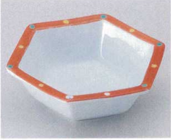
171-505-7 960円 朱巻点紋六角鉢 (11.3×10×3.5) 516960407