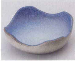
171-303-78 920円 青雲角鉢 (11×11×4) 516930478