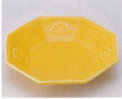
171-304-34 900円 黄袖漢詩彫八角小皿 (11.5×12.3×2.3) 516930534