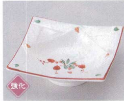
171-101-74 1,450円 赤絵喜び松花堂 (11×11×3.8) 516910374