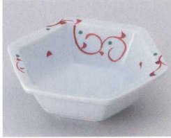
171-504-47 980円 唐草六角鉢 (11.2×10×3.5) 516960147