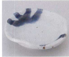
171-301-30 950円 かいらぎ三ツ押小鉢 (12×3.5) 517090230