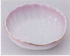
171-204-30 990円 ピンク吹貝型小鉢 (12×11.5×4) 517050130