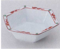
171-503-47 980円 赤絵小波六角鉢 (11.2×10×3.5) 516960247