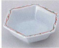
171-502-7 1,080円 スキ六角鉢 (11.3×10×3.5) 516950507