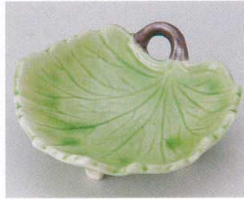
171-202-35 1,000円 グリーン木の葉小鉢 (12×11×4.3) 516920535