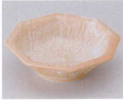
171-604-5 590円 志野八角鉢 (11.2×11.2×3.5) 517060405