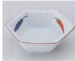
171-601-47 800円 とうがらし六角小鉢 (11.2×10×3.5) 516960347