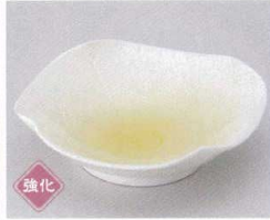
171-302-34 950円 黄磁四方押小鉢 (11.5×3.4) 516930334