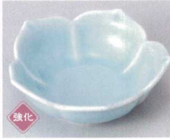
171-203-70 1,000円 青白磁桔梗小鉢 (11×11×3.6) 617120370