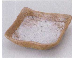
171-401-47 650円 うのふ茶唐津角小鉢 (11×11×3) 516940347