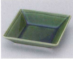
171-404-60 500円 織部四方取皿(小) (11×11×2.5) 516950160