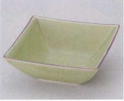
171-105-34 1,050円 刷錆ヒワ京型角小鉢 (11.2×11.2×4.3) 516930234