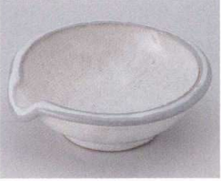
171-205-30 950円 御本手くしめ片口小鉢 (12.5×12×4.3) 517050330