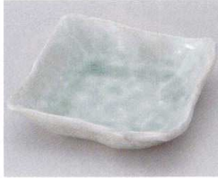
171-403-74 620円 白化粧角鉢 (10.8×10.8×2.7) 516940574