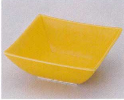
171-104-34 1,070円 黄袖京型角小鉢 (11.2×11.2×4.3) 516930134