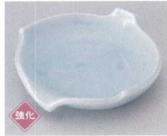
171-201-76 1,100円 青白磁葉型浅鉢 (12×12×2.8) 516920276