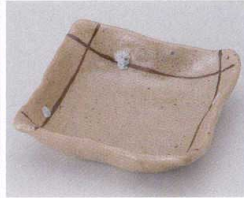
171-402-47 650円 唐津ライン角小鉢 (11×11×3) 516940447