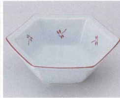
171-602-47 730円 トンボ六角鉢 (11.2×10×3.5) 516960447