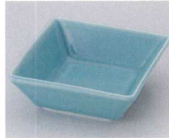
171-501-25 550円 青磁角小鉢 (10.2×10.2×3.6) 516950325