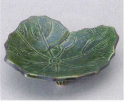
171-305-34 860円 織部つわぶき三ツ足皿 (12.5×11×3) 516940234