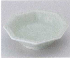
171-603-5 740円 志野八角鉢 (11.2×11.2×3.5) 516960505