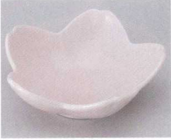
171-605-78 420円 桜型小鉢 (10.5×3.5) 517160378