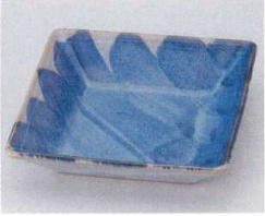
171-405-60 500円 灰釉コス四方取皿(小) (11×11×2.5) 516950260