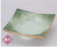
171-103-78 1,080円 緑彩松花堂 (11×11×3.8) 516910578