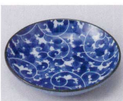
183-603-58 250円 外削り江戸唐草取皿 (13.5×3) 518160458