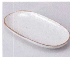
183-401-79 420円 潤サビ楕円皿 (17.7×9.4×2) 518350479