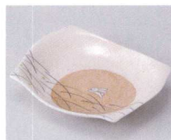
183-501-47 350円 遊月手造り4.0皿 (12.8×15×2.8) 518360347