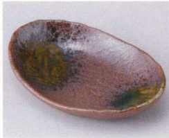
183-302-52 450円 ふる里楕円銘々皿 (15.5×10.5×3) 518120452