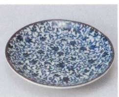
183-605-28 230円 益子唐草 4.0皿 (13.8×2.2) 618360528