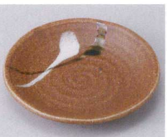
183-505-34 300円 木曾路4.0皿 (14×2) 518150434