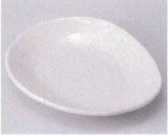
183-204-79 450円 志野銘々皿 (15.8×12.7×2.4) 518530577