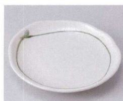
183-601-58 300円 グリーン珍取皿 (13.5×14.5×1.8) 518150558