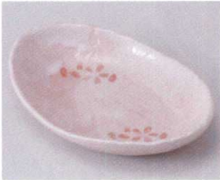
183-303-52 450円 桜志野楕円銘々皿 (15.5×10.5×3) 518120552