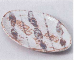
183-105-46 640円 志野ストライプ葉型皿(小) (17.3×11×1.5) 505310146