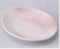
183-205-79 430円 桜志野銘々皿 (16×12.7) 518340477