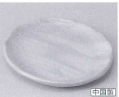
183-405-63 350円 粉引14cm楕円皿 (14×13×1.3) 518150163