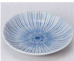
183-503-62 340円 千筋 4.0皿 (13.8×2.4) 618350362