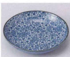
183-602-58 250円 外削り京小紋取皿 (13.5×3) 518160558