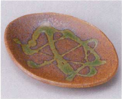
183-104-51 640円 伊賀流楕円皿 (16.7×12.3×1.8) 518510551