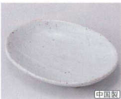
183-403-63 340円 粉引足付タ円皿 (14×11×2.5) 518150263