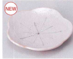
183-201-34 680円 桜志野梅型銘々皿 (14×14×2.5) 618320134