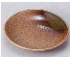
183-502-62 340円 伊賀吹12cm深皿 (12.5×2) 618350262