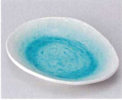
183-203-47 470円 白流水変形皿(小) (15.5×12.7×2.2) 618320347