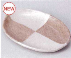
183-102-74 720円 唐津化粧楕円5.5皿 (16.2×11.8×1.5) 618310274