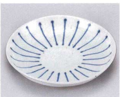
183-504-28 300円 古染十草三ッ山4.0皿 (14.3×2.8) 520110828