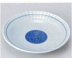
183-604-28 240円 淡青祥瑞 4.0皿 (13.8×2.6) 618360428