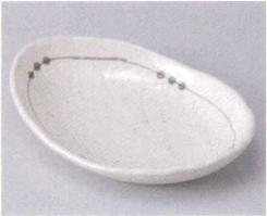
183-304-52 450円 粉引ヒスイ楕円皿 (15.5×10.5×3) 518120352