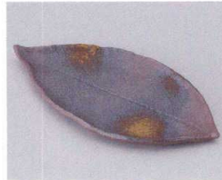
183-101-25 760円 びぜん柿の葉(大) (19×9.5×1.5) 517930225