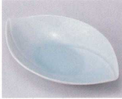
183-202-1 560円 青白磁しずく小皿 (15.6×10.3×2.5) 518520301