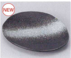
183-404-79 380円 金彩楕円皿 (15×12.5) 618340479