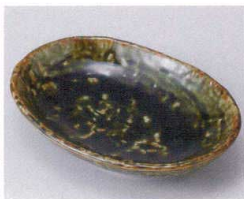
183-402-62 400円 織部石目14cm取皿 (16×11.5×3) 518350562