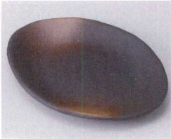
183-103-51 640円 黒伊賀楕円皿 (16.7×12.3×1.8) 518510351