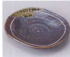
183-301-58 480円 鉄釉一珍ライン小判取皿 (15×13×2.5) 518530358