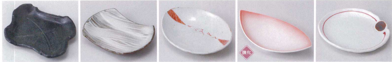
187-101-35 2,000円 手造り窯変黒取皿 (17×14.5×3) 519110535 187-102-34 1,400円 刷毛目分銅型皿 (16.2×12×3) 518410334 187-103-56 1,350円 赤絵流紋銘々皿 (16.5×13×2.5) 518650356 187-104-78 1,200円 舟型多用皿(ピンク) (17.3×9.5×3.1) 518420278 187-105-35 1,100円 錆丸一珍珠彫込中皿 (15×13.2×1.5) 518420335