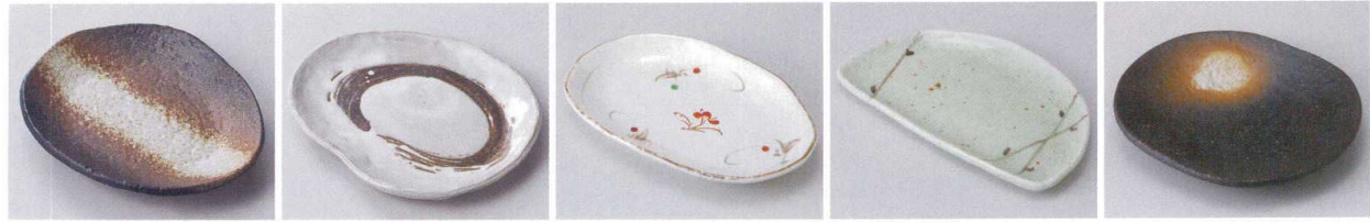
187-601-79 630円 黒備前変形皿(大)(17.514.52.8) 618760179 187-602-79 450円 黒備前変形皿(小)(16×12.7) 618760279 187-603-60 560円 粉引刷毛ハート取り皿 (16.3×13.7) 618760360 187-604-17 540円 染錦唐草銘々皿 (17.7×11.7×2.3) 519060517 187-605-1 500円 ヒワ均窯半月皿 (17.8×10.5) 518530101 187-606-79 500円 おぼろ備前小判和皿 (13.4×15.4×2.2) 518940379