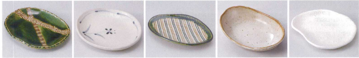
187-301-5 880円 現代織部銘々皿 (16.2×12.8×2) 518440105 187-302-75 800円 草花 変形皿(中) (15.5×13.5×2) 518440475 187-303-10 800円 織部二色十草取皿 (17×10.6×2.1) 517920310 187-304-52 800円 うのふ小判皿 (16.3×12×3.6) 618730452 187-305-52 750円 斑点粉引豆型皿 (17×13.2×2) 519050452