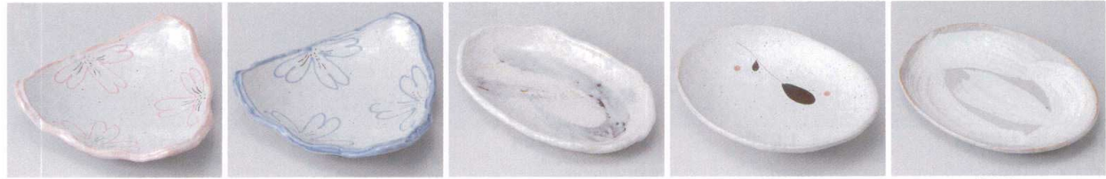
187-501-74 670円 シンプルフラワー三角皿(赤) (14.5×3.5) 518460474 187-502-74 670円 シンプルフラワー三角皿(青) (14.5×3.5) 518460574 187-503-78 650円 志野茶刷毛小判皿 (17.3×11×2) 518520278 187-504-26 650円 粉引めばえ楕円取皿 (16.2×12.5×2.8) 518510426 187-505-75 600円 刷毛目楕円取皿 (17×13×1.8) 518520175