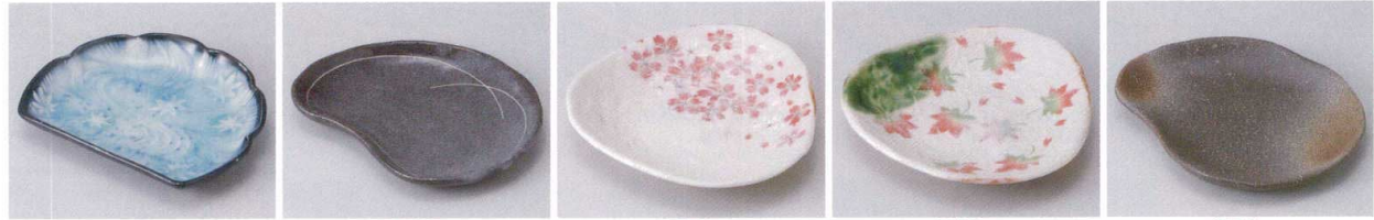
187-401-47 760円 清流水天目半月銘々皿 (15.5×12.8×2.3) 518820347 187-402-73 720円 黒化粧彫結びそら豆皿 (16.5×12.5×2) 518450473 187-403-52 710円 平安桜三角皿 (14×15×2.3) 518460152 187-404-52 710円 織部春秋銘々皿 (14×15×2.3) 518450552 187-405-52 670円 古窯豆型皿 (17×13.2×2) 518850152