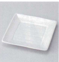
193-503-31 560円 白マット角取皿 (14×14×2) 519150531