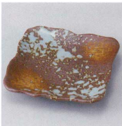
193-402-15 730円 備前白四ツ足角皿(中) (15×14.5×3) 519140515