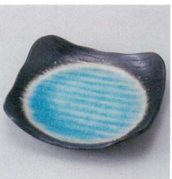
193-504-40 450円 姫胡蝶銘々皿 (15×15×3.5) 519160240