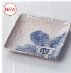
193-201-46 1,350円 ひし葉 6.0角皿 (15.8×2) 619320146