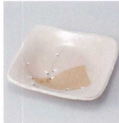
193-101-5 2,400円 あけぼの銘々皿 (16×15×3) 519110205