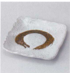
193-502-60 560円 粉引刷毛角取り皿 (15.5×15.5×2.4) 519160160