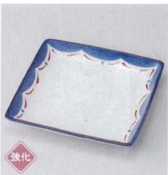
193-204-70 1,160円 赤絵波重ね5.0正角皿 (14.8×14.8×2.5) 519120471