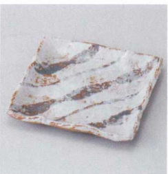
193-304-46 900円 志野ストライプ5寸正角皿 (15×15×2.3) 519130446