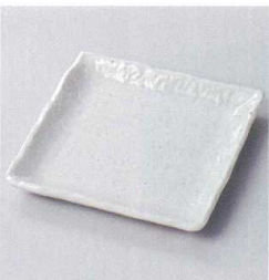
193-403-15 700円 白粉引四角皿 (16.5×16.3×2) 619340315