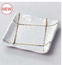
193-305-70 850円 粉引らせん5.0正角皿 (14.5×14.5×2.5) 619330570