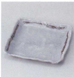
193-302-78 1,030円 単志野正角皿 (16×16×2.2) 519130178