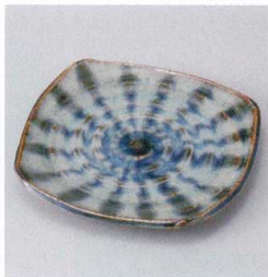
193-202-70 1,270円 御深井十草5.5皿 (15.6×15.4×2.5) 519120371