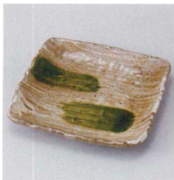
193-501-51 600円 黄瀬戸四角とり皿 (15.5×15.5×2) 519150451