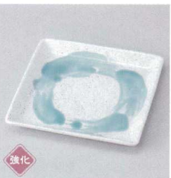
193-205-70 1,160円 筆あそび正角皿 (15.6×15.6×1.8) 519120571