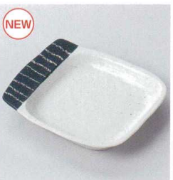
193-405-28 670円 塗り分け十草 取皿 (16.3×14×2.7) 619340528