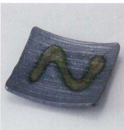
193-303-51 1,000円 南蛮Nライン5.5角皿 (16.3×16.3×3.8) 519130551