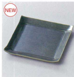
193-301-35 1,150円 ココリ正角皿 織部 (16.5×16.5×2.4) 619330135