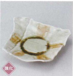
193-105-61 1,600円 ビードロ変型皿 (17×16×4) 519020361