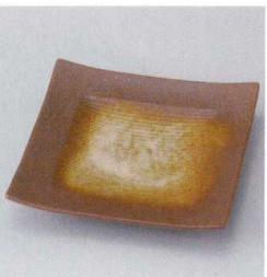
193-404-26 700円 伊賀風千段角皿 (15×15×2.8) 519150126