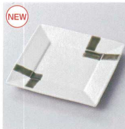
193-401-35 1,000円 ささやきスクエア16cm銘名皿 (16×16×2) 619340135