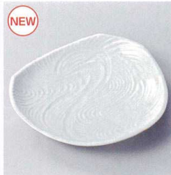
193-102-47 2,240円 白磁(強化)6.0三角皿 (16.8×2.8) 619310247