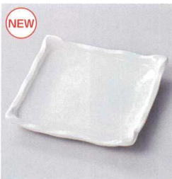
193-203-34 1,210円 N.B四方上り皿(小) (15×15×2.3) 619320334