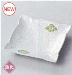
193-103-70 2,100円 真珠実り梅5.5正角皿 (15.3×15.3×2.9) 619310370