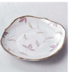
193-505-40 270円 新めばえ 銘々皿 (15.3×15.3×3) 619350540